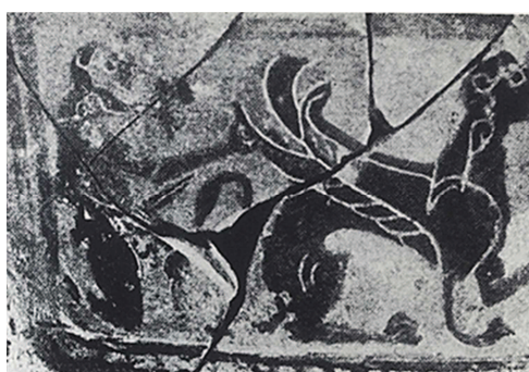
Figura 11. Tebe, Mus. Arch. = Krauskopf 1982, fig. 2.

Il kantharos beotico datato al secondo quarto del VI sec. a.C. costituisce dunque la prima testimonianza figurativa del motivo dell'uccisione della Sfinge (Tebe, Mus. Arch. = Borrows-Ure 1907, pp. 260-61, foto pl. X a, f, g = fig. 11). 101 L'identificazione di Edipo nell'uomo raffigurato alle spalle del mostro non è accettata universalmente, ma