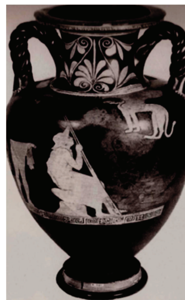
Figura 10. Oxford 526 = Cat. 90 Moret 1984.

L'immagine di Edipo-viaggiatore proposta dalla kylix del Vaticano è certamente la più diffusa nel V sec. a.C.; se ne conoscono molti celebri esempi, tra cui ricordo in questa sede soltanto la pelike del Pittore di Achille (Berlin, Staatliche Museen F 2355 = fig. 9), datata al 440 a.C. circa, in cui Edipo, con il petaso calato sulle spalle, è un giovane imberbe in piedi davanti alla Sfinge rannicchiata su una roccia, e un'anfora dello stesso periodo (Oxford, Ashmolean Museum 526 = fig. 10) in cui Edipo-viaggiatore, seduto davanti al mostro, è accompagnato da un uomo raffigurato alle sue spalle. 98