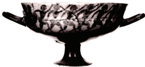
Figura 6. Siracusa 25.418 = Cat. 1 Moret 1984.

Torniamo alle testimonianze iconografiche. Le scene presenti sull'anfora clazomenia (fig. 3) e sull'anfora di Stuttgart (fig. 4), incentrate sul motivo dell'enigma, sono casi eccezionali nel VI sec. a.C., epoca in cui invece dominano rappresentazioni della Sfinge che attacca i giovani, come appare, ad esempio, dalla decorazione della coppa di Siana conservata a Siracusa (Mus. Naz. 25.418 = fig. 6), datata al 570-560 a.C. ca. 94 La rappresentazione figurativa dell'enigma, i cui primi esempi appartengono alla seconda metà del VI sec., si affermerà nella ceramica attica solo dopo il 467 a.C. quando Eschilo mise in scena il dramma satiresco Sfinge , coronamento della trilogia tragica dedicata a Tebe; è allora che si impone il motivo di Edipo solo di fronte al mostro: uno dei primi esempi è un cratere conservato nel Museo di Lecce (Museo Prov. Sigismondo Castromediano 610 = fig. 7), di poco posteriore alla rappresentazione del dramma satiresco eschileo, che ritrae Edipo stante, appoggiato a un lungo bastone, davanti alla Sfinge assisa su una colonna. La posa di Edipo, che per prestare attenzione alle parole della Sfinge arresta la marcia e si appoggia a un sostegno, in questo caso un bastone, altre volte una lancia, ricorda l'atteggiamento tanto di chi ascolta quanto di chi parla e l'ambivalenza è decisamente pertinente alla situazione mitica; essa è inoltre una rappresentazione simbolica di «équilibre transitoire, suspension momentanée du temps, balancement intérieur» 95 .