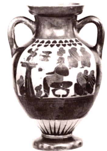
Figura 4. Stuttgart 65/15 = Cat. 101 Moret 1984.

Il motivo della risoluzione dell'enigma da parte di Edipo è diffuso nell'arte figurativa greca a partire dall'ultimo quarto del VI sec. a.C.; la sua prima apparizione si data al 540 a.C. ca., quando su un'anfora clazomenia si raffigura un uomo, da identificare con Edipo, che fronteggia impassibile la Sfinge (London, Brit. Mus. B 122 = fig. 3). 78 Di poco posteriore (530-525 a.C.) è un'anfora di discussa provenienza (Stuttgart, Württembergisches Landesmuseum 65/15 = fig. 4), forse italo-meridionale, decorata con il