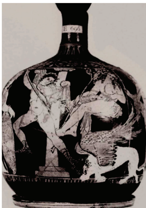
Figura 12. London, Brit. Mus. E 696 = Cat. 105 Moret 1984.

Per concludere, vorrei ricordare una lekythos attica a figure rosse di fine V sec. a.C. (London, Brit. Mus. E 696 = fig. 12), interessante soprattutto per quanto concerne la decorazione; l'opera è stata utilizzata da