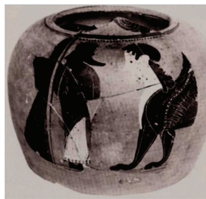
Figura 3. London, Brit. Mus. B 122 = Cat. 100 Moret 1984.

Il più infelice fra gli eroi, e il più inerme, ma anche colui che fa un passo di là dagli eroi, è Edipo. Il rapporto con il mostro è un contatto, pelle contro pelle. Edipo per primo non tocca il mostro, ma lo guarda, e gli parla. Edipo uccide con la parola, getta nell'aria parole mortali come le formule magiche scagliate da Medea contro Talos. Dopo la risposta di Edipo, la Sfinge precipitò in un baratro. Edipo non scese a scorticarne la pelle, quelle squame variegata che allettavano i viaggiatori come le ricche vesti di un'etera orientale. Edipo è il primo che pretese di fare a meno del contatto con il mostro. Fra tutte le sue colpe, la più grave è quella che nessuno gli rimprovera: non aver toccato il mostro. Edipo è cieco e mendico perché non ha una Gorgone che lo difenda sul petto, una pelle di fiera che gli copra le spalle, un talismano da stringere in mano. La parola permette una vittoria troppo pulita, che non lascia spoglie. Ma proprio nelle spoglie si cela la potenza. La parola può vincere là dove fallisce ogni altra arma. Ma rimane nuda, e solitaria, dopo la sua vittoria. 77