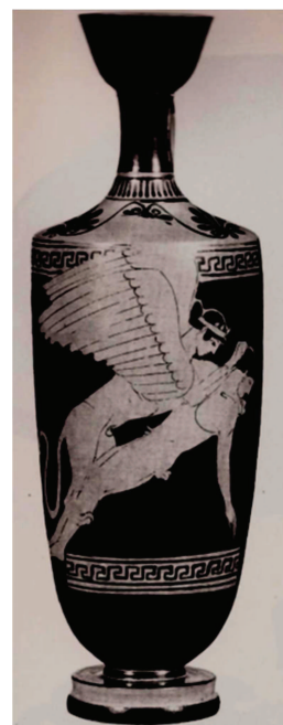
Figura 1. Kiel B 555 = Cat. 25 Moret 1984.

PMG 672 offre, poi, due notizie altrimenti sconosciute relative a Corinna, che si rivela unica fonte letteraria sull' uccisione da parte di Edipo di due mostri che angustiavano Tebe, la Sfinge e la volpe Teumessia. Edipo doveva quindi essere, nella poesia corinniana, l'equivalente tebano di Eracle e Teseo, un eroe civilizzatore capace di liberare il territorio tebano dai due mostruosi esseri legati forse da un dato comune: danneggiare la città di Tebe colpendone in primo luogo i giovani. 61 La Sfinge, infatti, divora giovani e adulti in Oedipod. fr. 1 B. (= 3 W. = schol. Eur. Phoe. 1760, 414, 5-7, 31-33 Schwartz) ed è spesso raffigurata nell'atto di rapire giovani tebani: emblematici esempi sono due lekythoi a figure rosse, una conservata a Kiel (Kiel, Kunsthalle B 555 = fig. 1) e datata al 470 a.C. ca., l'altra, datata al 420 a.C. ca., ora ad Atene (Athens, Mus. Nat. 1607 = fig. 2), raffiguranti la Sfinge che spicca il volo mentre tiene tra le zampe la giovane preda, in entrambi i casi un ragazzo nudo e imberbe. 62 Alle fauci della volpe Teumessia, racconta lo Pseudo-Apollodoro, venivano invece destinati bambini tebani esposti regolarmente fuori dalla città per placare la belva (2.4.6-7). 63