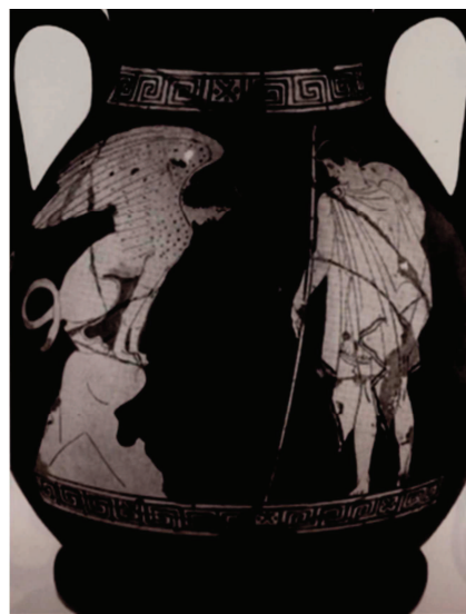
Figura 9. Berlin, F 2355 = Cat. 79 Moret 1984.

L'opera più celebre del periodo è la kylix del Vaticano (Vat. 16.541 = fig. 8), più o meno contemporanea al cratere di Lecce: Edipo, seduto, porta la mano al mento, assorto nell'ascolto e nella riflessione; è rappresentato come viaggiatore, con le endromides legate sui polpacci, l'ampio petaso in testa e la corta clamide che gli ricade sulla schiena. Dall'iscrizione visibile davanti alla bocca della Sfinge, lo spettatore comprende che il mostro sta recitando l'enigma e che il contenuto di quest'ultimo corrisponde a quello noto grazie ad