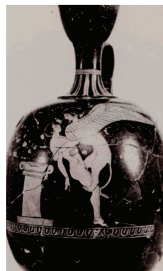
Figura 2. Athens 1607 = Cat. 26 Moret 1984.