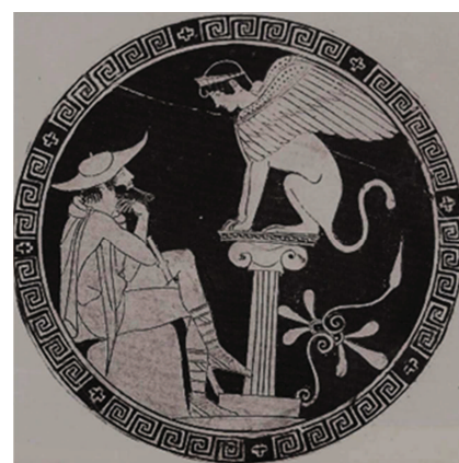
Figura 8. Vat. 16.541 = Cat. 87 Moret 1984.