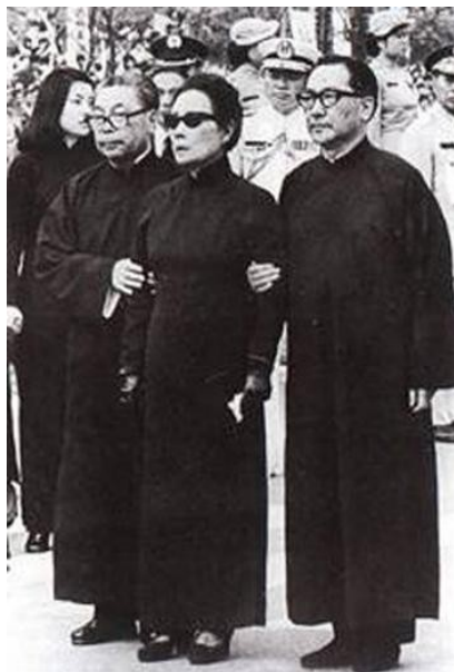
fig.15 Madame Chiang al funerale del marito nel 1975, sostenuta dai figliastri Chiang Ching-kuo (alla sua destra) e Chiang Wego (sinistra).

Mentre i giornalisti di tutto il mondo accusavano Chiang di aver perso la Cina, gli abitanti dell'isola di Taiwan furono costretti al lutto nazionale. Teatri e altre case di intrattenimento vennero chiusi per un mese; giochi come il golf e il biliardo furono vietati; le televisioni poterono trasmettere soltanto film sulla vita o il funerale del Generalissimo.