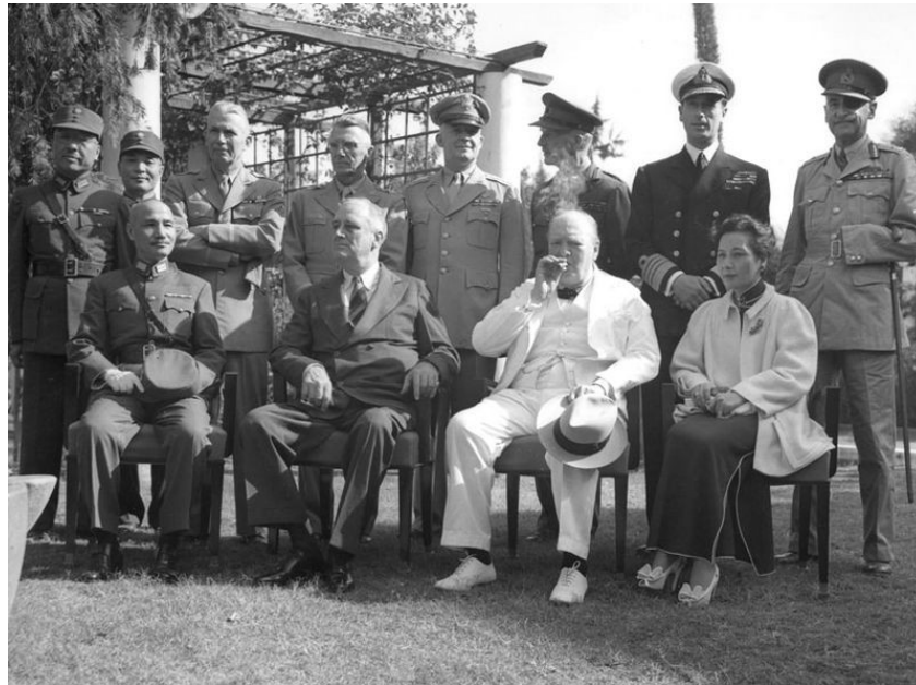
fig.10 Conferenza del Cairo nel novembre 1943: vengono ritratti seduti Chiang Kai-shek, Roosevelt, Churchill e Song Meiling, sebbene non fosse un capo di Stato.

Durante la Conferenza venne anche affrontato il problema dell'Exclusion Act, cosa che fece spazientire il Primo ministro inglese, deciso a parlare “solo di cose importanti”.