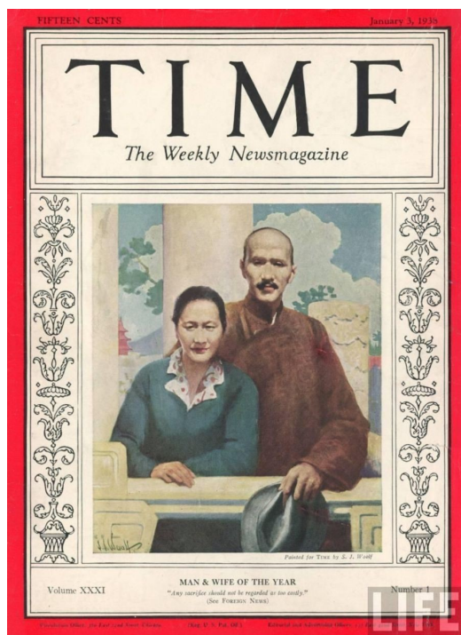
fig.5 Copertina del Time, 3 gennaio 1938.

I soldati delle truppe giapponesi nella capitale caduta, ubriachi e in festa, commisero per sette settimane ogni genere di brutalità e ed efferatezze sui civili disarmati: non fu solo una violenza di massa sulle donne di ogni età, ma molti documenti testimoniano di mutilazioni sulle ragazze, fucilazioni di bambini e decapitazioni di massa. Il triste evento rimarrà famoso nella storia come il massacro di Nanchino 70 . Meiling ne fu sconvolta.