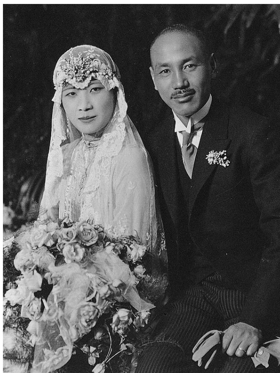
fig.3 Ritratto di Song Meiling e Chiang Kai-shek durante la celebrazione del loro matrimonio, 1 dicembre 1927.

Meiling raggiunse il marito: i due si inchinarono prima davanti al ritratto di Sun Yat-sen, poi alla bandiera sulla sinistra e alla bandiera sulla destra. La sposa e lo sposo continuarono come da tradizione a profondersi in inchini l'un davanti all'altro, poi verso i testimoni e infine verso gli ospiti. Il certificato di matrimonio fu letto dall'assemblea e sigillato. Non ci furono né baci, né “gesti imbarazzanti” 71 .