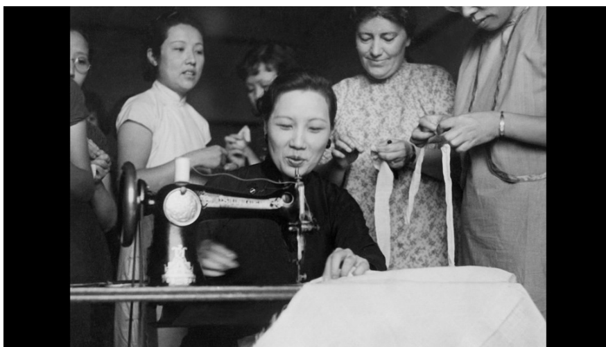
fig.6 Madame Chiang Kai-shek cuce le divise per i soldati al fronte.

mentre visitava gli orfani, distribuiva regali ai soldati feriti, curava le ferite, ammirava una macchina a raggi x e in tutto ciò che la facesse sembrare una first lady “buona.”