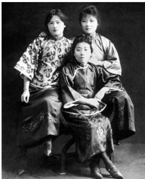
fig.2 Le tre sorelle Song. Ailing siede al centro, Meiling a destra e Qingling sulla sinistra.