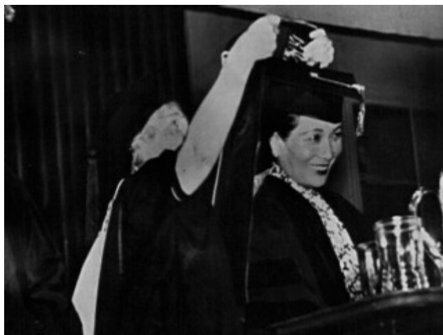
fig.9 Madame Chiang al Wesleyan College durante l'assegnazione della laurea ad honorem.

volta: il presidente le comunicò che Formosa (Taiwan per i cinesi) sarebbe tornata alla Cina dopo la guerra, ma che gli Stati Uniti avrebbero dovuto avere una base lì.