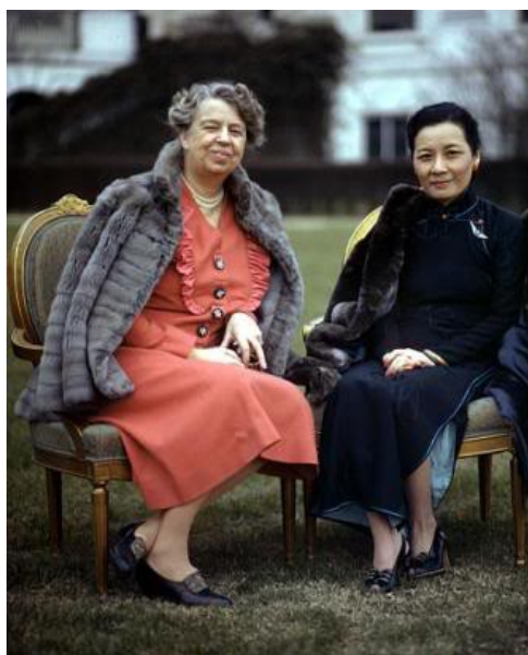
fig.8 Madame Chiang con Eleanor Roosevelt nel giardino della Casa Bianca, 1943.