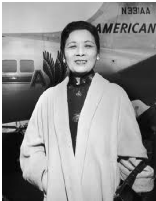
fig.4 Song Meiling, alle sue spalle un aereo dell'aviazione americana.

Adesso la Cina era veramente in guerra. La posizione di Meiling a capo dell'aviazione era di importanza critica. Le forze aeree erano in condizioni penose, specialmente comparate a quelle nemiche. I cinesi non avevano aerei, piloti, armi, esperienza, e più in generale tutto ciò che era necessario a un moderno aereo da combattimento.