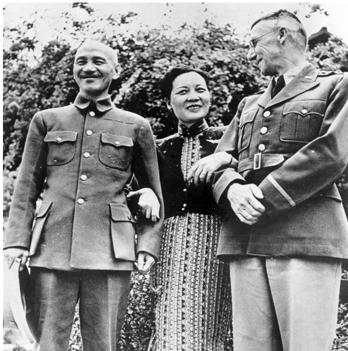
fig.11 I coniugi Chiang con il generale Joseph Stilwell, comandante delle forze armate americane in Cina.

Chiang intanto continuava a lamentarsi dell'atteggiamento di Stilwell nella campagna di Burma e delle macchinazioni dei comunisti: quell'anno i giapponesi lanciarono a Burma l'operazione Ichigo,