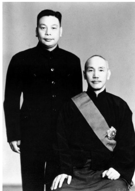
fig.14 Chiang Kai-shek e il figlio Ching-kuo, fotografia risalente al 1948.

Subito dopo essere volato a Taiwan nel 1949, infatti i Chiang iniziò ad essere geloso di Wu. Quando Meiling nel 1950 organizzò una conferenza stampa per giornalisti americani, questi si concentrarono sul carismatico ed eloquente governatore, cosa che non fu certo apprezzata dal Generalissimo; inoltre Wu disturbava il Presidente con la continua richiesta di riforme democratiche e il permesso di creare partiti di opposizione, mentre Chiang permetteva soltanto elezioni libere a livello locale.