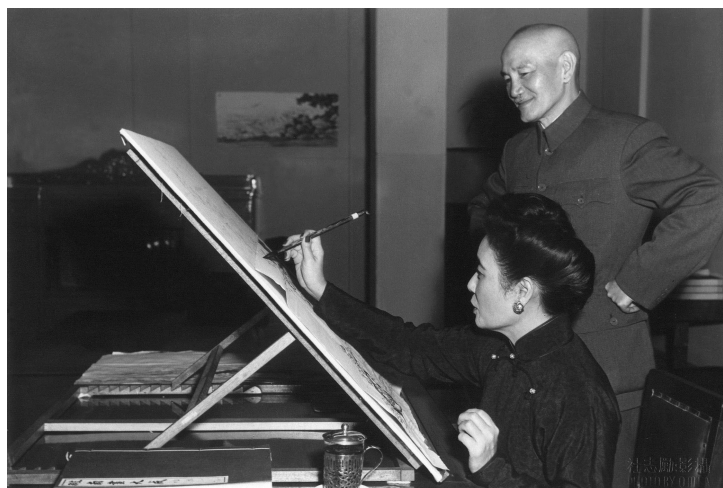
fig.13 Meiling dipinge osservata dal Generalissimo.

“Dipingere è l'occupazione che più mi ha assorbito in tutta la mia vita,” scrisse. “Quando dipingo, dimentico tutto ciò che appartiene al mondo, e spero di poter sfruttare il mio tempo dipingendo e dipingendo, nulla di più” 12 .