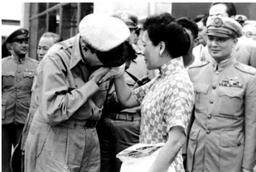
fig.12 Il famoso baciamao del generale americano Douglas MacArthur, giugno 1950.

Truman incaricò comunque i servizi segreti di indagare su come venivano spesi i soldi donati a Taiwan: l'FBI scoprì che una grossa somma di denaro tornava immediatamente negli Stati Uniti e veniva usato per corruzione, propaganda, e contributi a campagne politiche, con l'obiettivo di influenzare la politica interna di Washington.