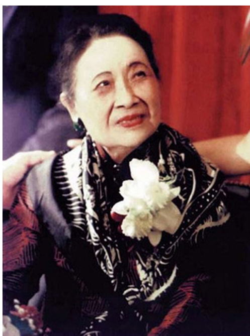
fig.16 Madame Chiang durante il ricevimento dato in suo onore dal senatore Paul Simon, 26 giugno 1995.

Il 25 marzo 2002 Madame Chiang festeggiò il suo centocinquesimo compleanno nel suo appartamento di New York, indossando un qipao di broccato color porpora e gioielli di giada: gli ospiti concordarono sul fatto che era meravigliosa.