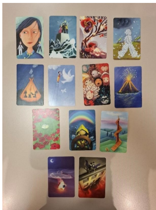
Carte Dixit scelte durante il primo incontro

OMINO FOGLIETTI: hanno tanti strumenti ma basta una folata di vento che rischiano di rimanere nudi;