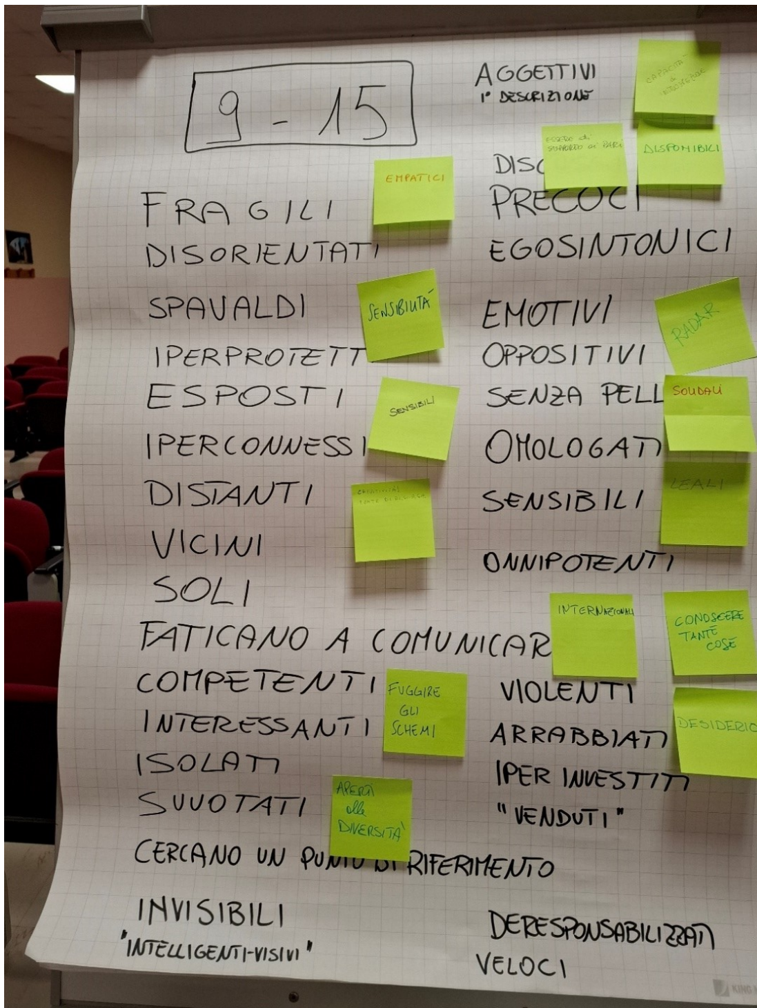
Cartellone aggettivi e potenzialità del primo incontro