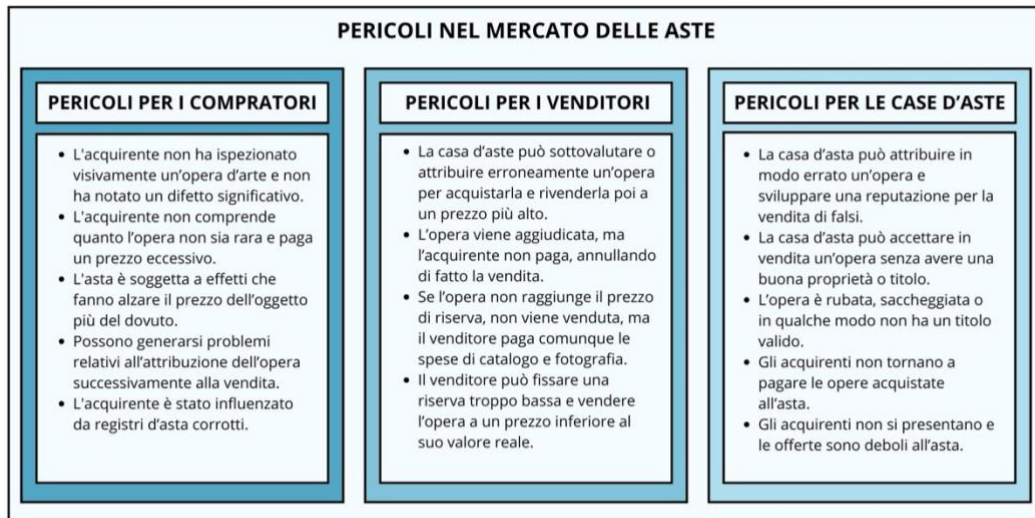
Figura 4, Pericoli nella compravendita di opere d'arte attraverso le case d'asta.