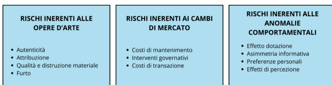
Figura 2, Schema dei rischi del mercato dell'arte.

Il seguente schema mostra i principali rischi nel mercato dell'arte.