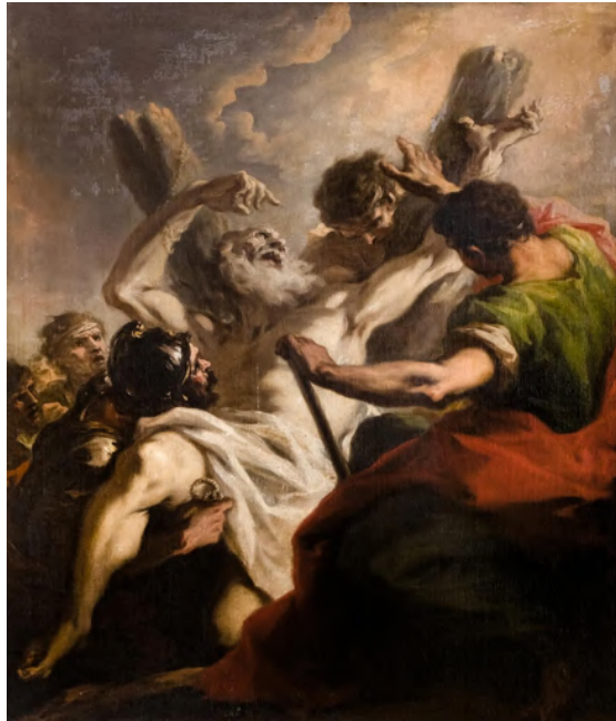
Fig. 19: Giovanni Antonio Pellegrini, Crocifissione di sant'Andrea , Venezia, chiesa di San Stae.

Il pittore si può considerare un rappresentante del "Barocchetto", artista di impronta classicistica orientato verso l'arte bolognese 213 . Zanetti scrive che il colorito dei suoi quadri era bello anche se non sempre vigoroso 214 .