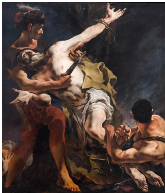
Fig. 23: Giambattista Tiepolo, Martirio di san Bartolomeo , Venezia, chiesa di San Stae.

Giambattista Tiepolo nel Martirio di san Bartolomeo (1722-23) dipinge tre figure disposte tutte nella stessa diagonale, quella centrale è il santo che sta per essere scuoiato, quelle ai lati sono i suoi carnefici, quello di sinistra intento a scuoiarlo con una lama, quello di destra intento a legargli le gambe. La maestria del Tiepolo è riuscita a rendere il momento di grande tensione emotiva provata dallo spettatore nell'atto di guardare l'opera stessa: dal volto del martire si colgono le emozioni, ma anche la profonda consapevolezza del gesto che si sta per compiere. Tiepolo gioca molto sulle forme disarticolate del corpo, ingigantendo parti anatomiche che di norma non dovrebbero essere così grandi nemmeno grazie all'uso della prospettiva; l'effetto che si ottiene è quello di aumentare la tensione emotiva, puntando l'attenzione specialmente sulle mani che sono rivolte in alto in un gesto di supplica e preghiera. L'effetto cromatico guida lo spettatore in questa voragine emotiva, giocando molto sul contrasto fra toni chiari e toni scuri. Secondo il Ruggeri, il Tiepolo con questa opera «porta a matura conclusione le premesse piazzettesche e ancor più bencovicciane» 224 . Vi è una certa assonanza fra il San Jacopo del Piazzetta e il San Bartolomeo del Tiepolo, dove la luce rompe le tenebre conferendo un impianto plastico che fa risaltare le figure; ma mentre