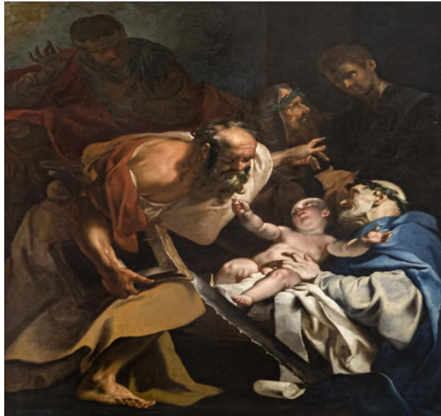
Fig. 22: Angelo Trevisani, San Simone , Venezia, chiesa di San Stae.

morì per la croce, mentre indica il miracolo alle sue spalle. Si tratta di una realizzazione pittorica potente nell'impianto scenico, dove l'influsso del Balestra viene superato facendo invece riferimento alla corrente Tiepolo-Bencovich-Pittoni, adottando una pittura chiaroscurale e drammatica che evidenzia la tensione e la drammaticità del momento 221 .