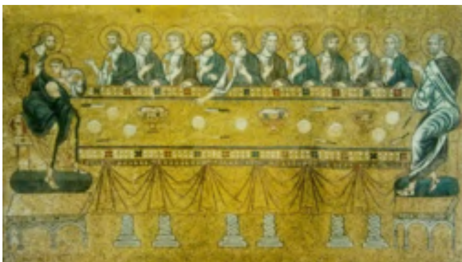
Fig. 3: L'ultima cena , mosaico, sec. XII. Venezia, Basilica di San Marco.

Inoltre, in questo mosaico l'artista vuole mettere in rilievo come le parole di Gesù seguano poi dei fatti: dopo la predicazione invita i suoi Apostoli a gettare veramente al largo le reti e pescare e questa seconda pesca si conclude in maniera miracolosa dato che tornano con abbondanza di pesci.