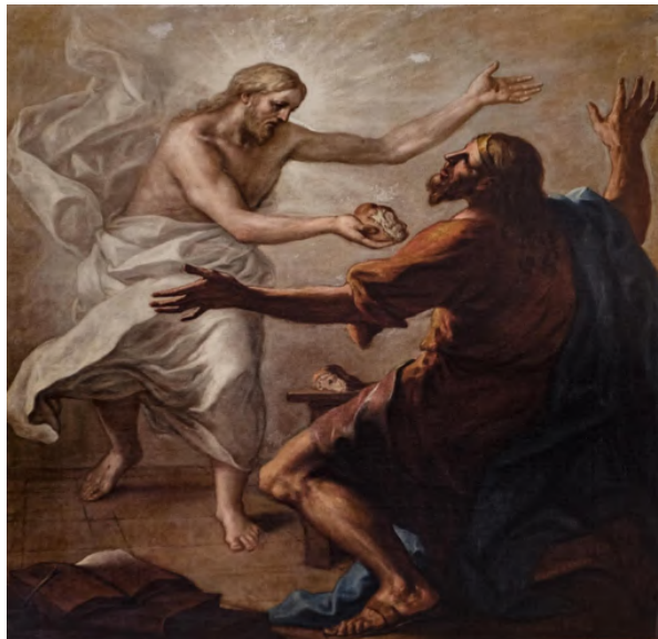
Fig. 15: Nicolò Bambini, San Giacomo Minore , Venezia, chiesa di San Stae.

lo sta percuotendo con un bastone 200 . Esponente della scuola locale, probabilmente fu scelto per dei precedenti rapporti con la famiglia dei Priuli e degli Stazio e ad esclusione del quadro di San Stae, egli è noto esclusivamente come ritrattista 201 .