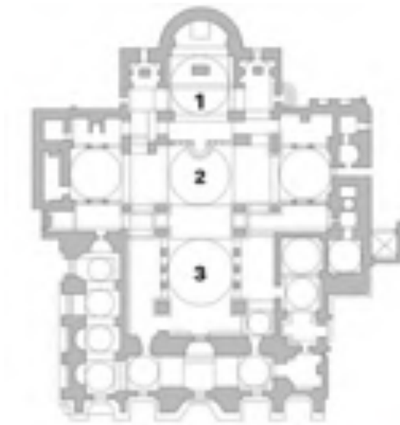
Fig. 1: Pianta della Basilica di San Marco (legenda: 1. Cupola dell'Emanuele, 2. Cupola dell'Ascensione, 3. Cupola della Pentecoste).

Lasciando alle spalle le scene veterotestamentarie della Genesi e dell'Esodo, che vanno dalla creazione alle vicende di Adamo ed Eva, per proseguire con Caino e Abele, il diluvio e la storia della torre di Babele, per finire con Abramo, Giuseppe e Mosè, entrando dalla porta centrale della basilica, si intravede nel catino absidale la maestosa immagine di Cristo Pantocrator in trono 102 .