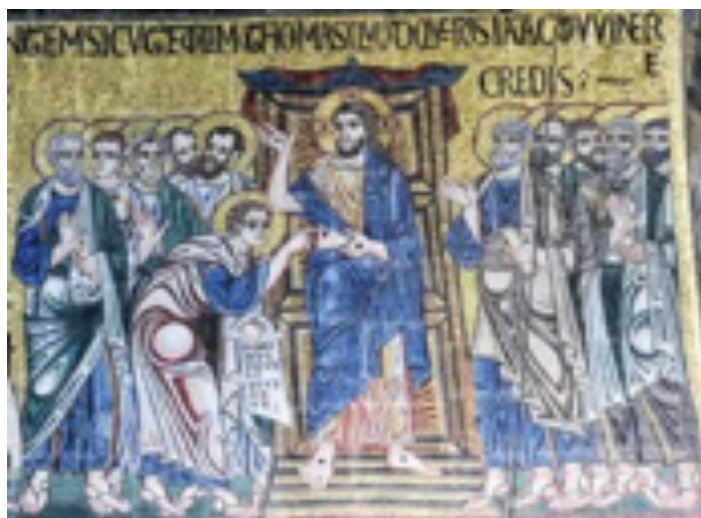
Fig. 6: L'incredulità di Tommaso , mosaico, sec. XII. Venezia, Basilica di San Marco.

La croce, portata in spalla dal Cireneo, richiama la via crucis e va a identificare, nel Vangelo di Luca, il modello del discepolo che va a seguire il Maestro.