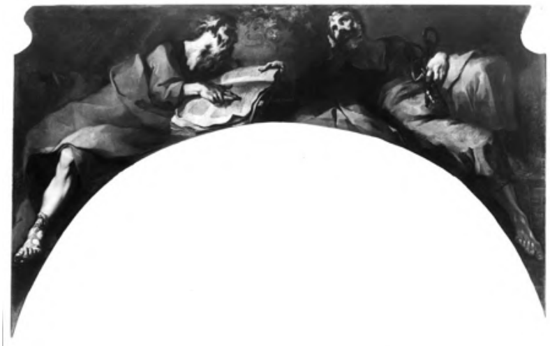
Fig. 11: Giambattista Tiepolo, Pietro e Paolo apostoli . Venezia, chiesa dell'Ospedaletto.