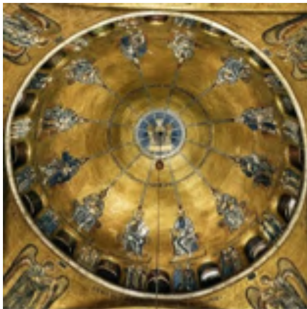
Fig. 8: Cupola della Pentecoste , mosaico. Venezia, Basilica di San Marco.

Vengono impersonati dai quattro fiumi biblici: Eufrate, Gihon, Pison e Tigri che attraverso l'irrigazione della terra, la trasformano in un nuovo giardino dell'Eden. Potrebbe fare allusione ad un augurio per la fortuna di Venezia, città che era stata fondata e viveva sulle acque e che celebrava proprio lo sposalizio con il mare nella festa della Sensa 137 .