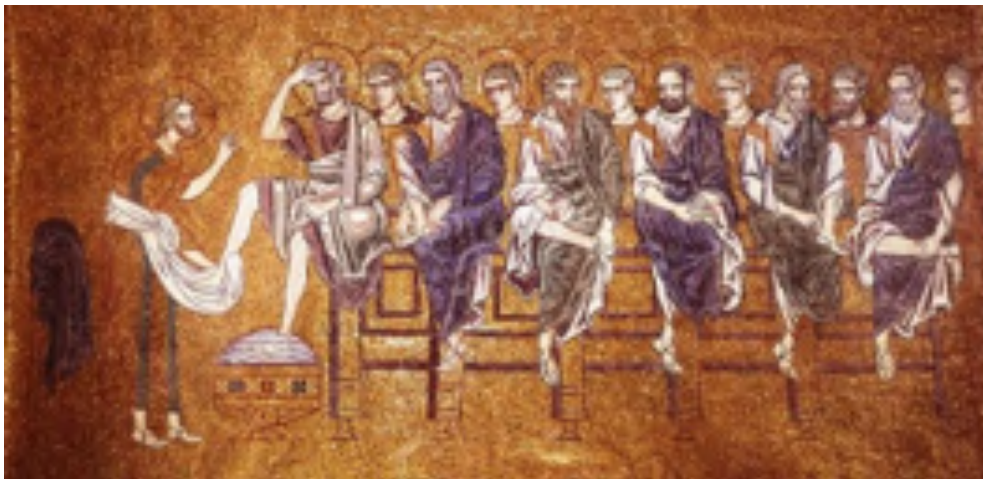
Fig. 4: La lavanda dei piedi , mosaico, sec. XII. Venezia, Basilica, di San Marco.

Gesù è seduto ad un’estremità del tavolo mentre Pietro si trova sull’altra, in Oriente erano considerati i posti d’onore; mentre Giovanni lo vediamo chinato verso Cristo in un atteggiamento di devozione.