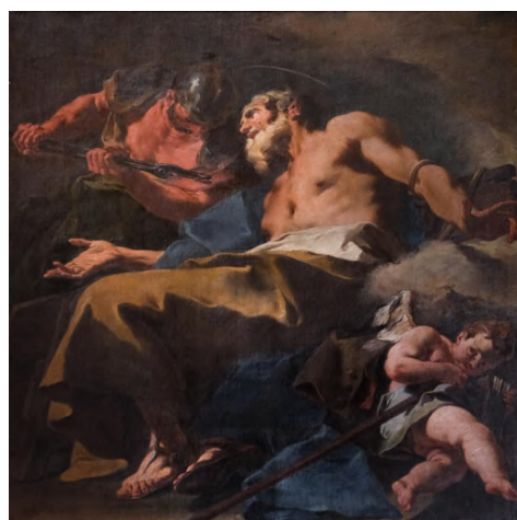
Fig. 16: Giambattista Pittoni, Martirio di san Tommaso , Venezia, chiesa di San Stae.

Nicolò Bambini nel San Giacomo Minore (1722-23) raffigura il santo nel momento in cui riceve il pane eucaristico da Gesù risorto. Pittore formatosi prima a Venezia con il maestro fiorentino Sebastiano Mazzoni, poi passato alla Scuola di Roma, in particolare a quella di Carlo Maratta, dove poté apprendere le leggi del buon disegno, dell'esattezza e dell'eleganza. Zanetti osserva che non era particolarmente abile nell'impasto e nell'utilizzo dei colori 202 .