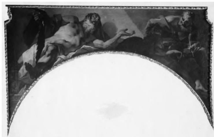
Fig. 9: Giambattista Tiepolo, Simone e Matteo apostoli . Venezia, chiesa dell'Ospedaletto.