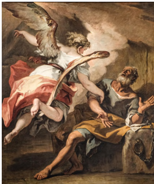
Fig. 24: Sebastiano Ricci, San Pietro liberato dal carcere , Venezia, chiesa di San Stae.

per il Piazzetta si percepisce un'atmosfera infuocata, dove il tessuto degli indumenti produce un effetto pittorico voluttuoso e le massicce figure sono eseguite con colpi di pennello caldi e sensuali, l'opera del Tiepolo è caratterizzata da una luce più fredda che fa risaltare il colore verde oliva del mantello del santo e il nudo dell'apostolo assume caratteri quasi scultorei e di un'irrequietezza ondulatoria dovuta all'influsso del Pagani e del Bencovich 225 . La tipica tecnica pittorica tiepolesca con alternanza di ombre e colpi di luce con le pennellate a tratteggio si evidenzia in particolare modo osservando la testa scorcata del santo e la brutale testa del carnefice. Pallucchini ritiene che l'artista, ben conoscendo i dipinti raccolti dalla famiglia Baglioni, per cui aveva affrescato la villa di Massanzago, abbia inserito nella composizione figurativa un intero brano del Solimena: viene ricalcato, ma in controparte, con il carnefice di schiena che sta legando le gambe del santo in basso a destra, il cammelliere della Rebecca al pozzo che oggi si trova al Museo del Louvre 226 .