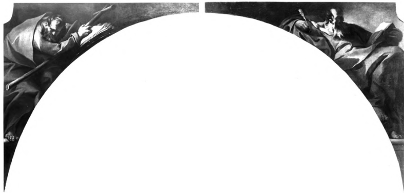
Fig. 12-13: Giambattista Tiepolo, Filippo e Giacomo apostoli . Venezia, chiesa dell'Ospedaletto.