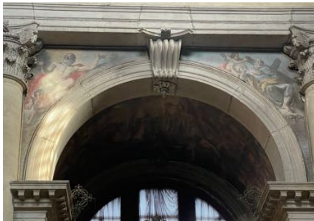
Fig. 31: Giacomo Guarana, Santi apostoli Bartolomeo e Filippo . Venezia, chiesa di San Pantalon.

1780-1781, periodo nel quale l'artista stava dipingendo per la chiesa altre tre tele che sono firmate e datate al 1781 255 . Ai piedi di Simone vi è un angioletto che regge una lunga sega simbolo del suo martirio. Matteo viene rappresentato mentre scrive con alla sua destra un Angelo, uno dei suoi attributi, mentre regge alcune penne. L'abbinamento di questi due Apostoli sottintende la loro storia: Simone era uno zelota, gruppo politico che all'epoca di Gesù lottava con le armi per la liberazione della Palestina, e si trova davanti Matteo, un esattore delle tasse per conto dei romani, categoria veramente detestata dagli zeloti; nonostante ciò, Simone invece di aggredire Matteo, congiunge le mani in preghiera perché Matteo sta scrivendo il Vangelo. Simone viene letteralmente disarmato dalla chiamata di Cristo a seguirlo.