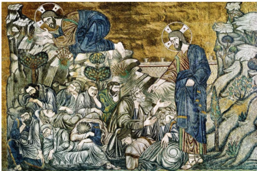
Fig. 5: L'orazione nell'orto , mosaico, sec. XIII. Venezia, Basilica di San Marco.

Una curiosità che salta subito all'occhio è che, come la rappresentazione precedente, tornano gli Apostoli divisi in imberbi e barbati; si può notare come ormai l'identificazione degli Apostoli passi attraverso delle iconografie prestabilite.