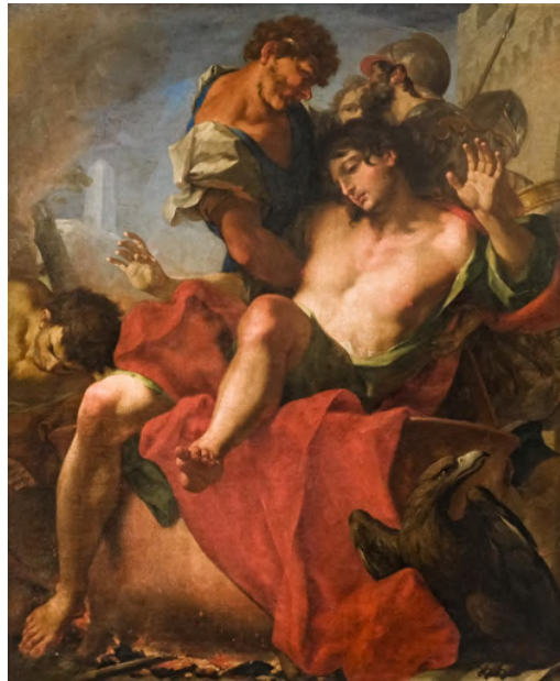
Fig. 25: Antonio Balestra, San Giovanni evangelista martirizzato , Venezia, chiesa di San Stae.

anche il giovane Tiepolo, nel rinnovato spirito dei tenebrosi 227 . Quando dipinse l'opera, era uno dei più famosi e affermati pittori di Venezia e d'Europa. La tela è una replica variata del dipinto eseguito nel 1710 per la chiesa parrocchiale di S. Pietro a Trescore Balneario (Bergamo), anche se ridotta nel numero delle figure e nei rapporti spaziali. La composizione diagonale dell'opera fa da struttura per gli altri quadri della serie, che da questo punto di vista sono analoghi 228 .