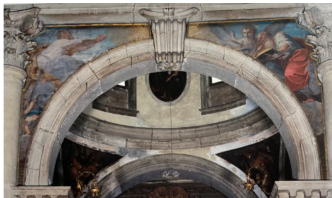
Fig. 30: Giovanni Faccioli, Santi apostoli Simone e Matteo Evangelista , Venezia, chiesa di San Pantalon.

I pennacchi esterni della cappella dedicata a San Bernardino rappresentano i Santi apostoli Mattia e Tommaso , opera di Alessandro Longhi (1733-1813) 251 . Mattia è il dodicesimo apostolo dopo la morte di Giuda Iscariota e viene rappresentato con in mano un'alabarda che da tradizione è un attributo del suo martirio. Tommaso, detto Didimo ovvero gemello, è colui che toccò le ferite di Gesù affinché potesse credere alla sua resurrezione; viene rappresentato con una squadra in quanto patrono dei muratori, architetti, geometri e scalpellini 252 . Alla sua sinistra sono presenti le teste di due angioletti 253 .