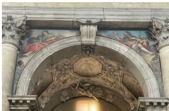
Fig. 27: Vincenzo Guarana, Santi apostoli Giovanni Evangelista e Giacomo Maggiore . Venezia, chiesa di San Pantalon.

Sopra la cappella di San Giovanni Battista nei pennacchi esterni sono raffigurati i Santi apostoli Andrea e Pietro , realizzati da Pietro Longhi (1701-1785) nel 1780, datazione presunta per analogia con gli altri dipinti in quanto non ci sono iscrizioni 246 . Andrea viene rappresentato in età avanzata con alle sue spalle la croce omonima, simbolo del suo martirio. Pietro viene rappresentato con una grande chiave nella mano destra e con l'indice della mano sinistra che indica la chiave 247 .