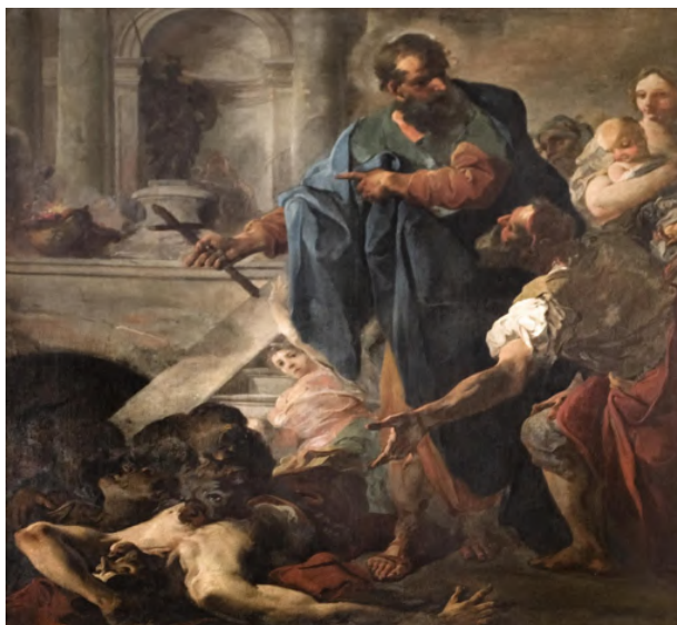
Fig. 21: Giambattista Mariotti, Miracolo di san Taddeo , Venezia, chiesa di San Stae.

Silvestro Manaigo nel San Matteo (1722-23) raffigura l'Apostolo mentre è intento alla scrittura del Vangelo con l'aiuto di un angelo. Il dipinto mostra ancora un gusto tenebroso tardo barocco che risente dell'influenza accademica degli insegnamenti del Lazzarini 218 , anche se lo stesso Lazzarini per il suo San Paolo manifesta una tecnica pittorica più luminosa 219 .