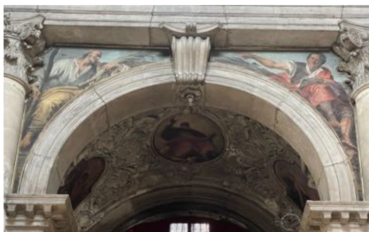
Fig. 28: Alessandro Tonioli, Santi apostoli Giacomo il minore e Taddeo . Venezia, chiesa di San Pantalon.

Nei pennacchi sopra la cappella dell'Addolorata troviamo rappresentati i Santi apostoli Giovanni Evangelista e Giacomo Maggiore , dipinti da Vincenzo Guarana (1742-1815) nel 1780. Giovanni sta scrivendo il Vangelo con a sinistra un'aquila, suo simbolo. Giacomo con il dito rivolto verso l'alto regge un bastone e sulla mantellina è raffigurata una conchiglia per bere 248 . L'opera è riconducibile alla prima attività nota del pittore e si caratterizza per un gusto ancora tardobarocco.