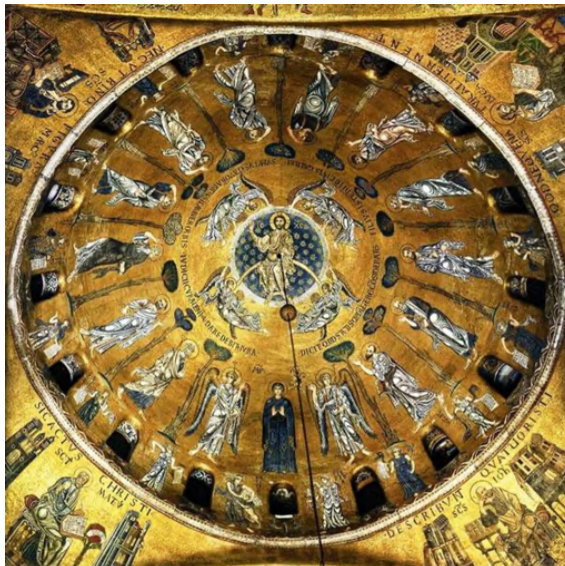
Fig. 7: Cupola dell'Ascensione , mosaico. Venezia, Basilica di San Marco.

Il cartiglio che l'Apostolo stringe in mano riporta l'iscrizione con all'interno la sua professione di fede 128 ; infatti, l'Apostolo non aveva avuto fiducia nei suoi discepoli quando, durante una sua assenza, avevano ricevuto la visita di Gesù 129 . L'iscrizione in latino, soprastante la scena, va a citare un discorso parafrasato: Tommaso che crede a Cristo solo perché ora ha toccato le sue piaghe 130 .