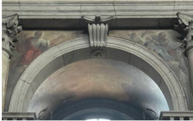
Fig. 29: Alessandro Longhi, Santi apostoli Mattia e Tommaso . Venezia, chiesa di San Pantalon.

I pennacchi esterni della cappella dedicata a San Bernardino rappresentano i Santi apostoli Mattia e Tommaso , opera di Alessandro Longhi (1733-1813) 251 . Mattia è il dodicesimo apostolo dopo la morte di Giuda Iscariota e viene rappresentato con in mano un'alabarda che da tradizione è un attributo del suo martirio. Tommaso, detto Didimo ovvero gemello, è colui che toccò le ferite di Gesù affinché potesse credere alla sua resurrezione; viene rappresentato con una squadra in quanto patrono dei muratori, architetti, geometri e scalpellini 252 . Alla sua sinistra sono presenti le teste di due angioletti 253 .