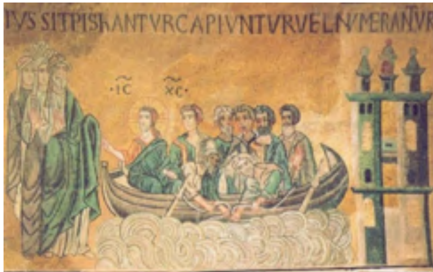
Fig. 2: La pesca miracolosa , mosaico, sec. XII. Venezia, Basilica di San Marco, cappella di Sant'Isidoro.

Tralasciando tutti gli altri mosaici, di seguito andremo a prendere in considerazione soltanto quelli che raffigurano gli Apostoli 105 .