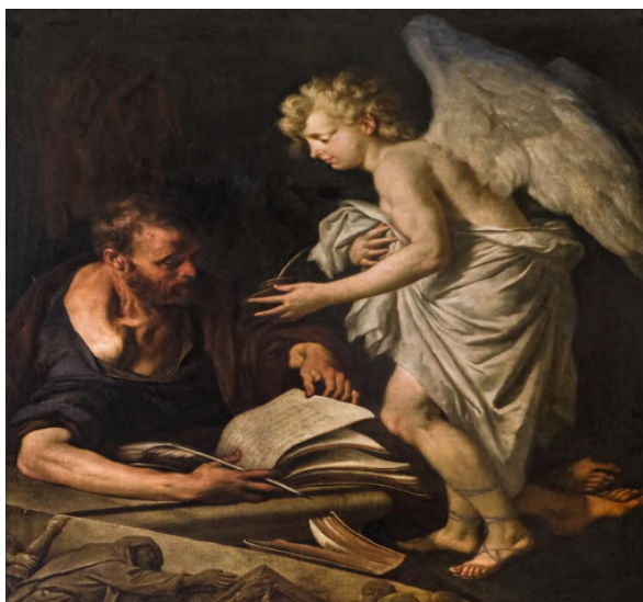
Fig. 20: Silvestro Manaigo, San Matteo , Venezia, chiesa di San Stae.

Silvestro Manaigo nel San Matteo (1722-23) raffigura l'Apostolo mentre è intento alla scrittura del Vangelo con l'aiuto di un angelo. Il dipinto mostra ancora un gusto tenebroso tardo barocco che risente dell'influenza accademica degli insegnamenti del Lazzarini 218 , anche se lo stesso Lazzarini per il suo San Paolo manifesta una tecnica pittorica più luminosa 219 .