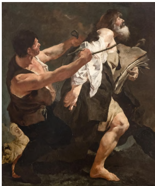
Fig. 17: Giambattista Piazzetta, Martirio di san Jacopo , Venezia, chiesa di San Stae.

Giambattista Pittoni nel Martirio di san Tommaso (1722-23) rappresenta l'Apostolo Tommaso mentre subisce il supplizio con delle lastre di metallo infuocate 203 . L'artista sembra subire l'influenza del San Pietro liberato dal carcere del Ricci, adottando un ritmo compositivo basato ugualmente sulla diagonale, e uniformarsi ai toni concitati e drammatici del Piazzetta e del Tiepolo, utilizzando una maniera chiaroscurale più aspra rispetto alle precedenti opere da lui realizzate 204 .