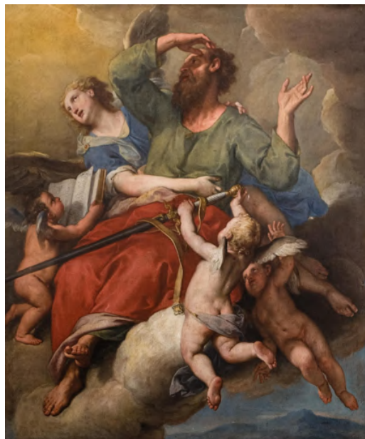
Fig. 18: Gregorio Lazzarini, San Paolo portato in cielo , Venezia, chiesa di San Stae.

è emotivamente coinvolto per l'intensità, la drammaticità del dipinto e la sua immediatezza 207 . L'anziano apostolo, tutto scarmigliato e scalzo, stringe il libro di pergamena, sbilanciando il muscoloso carnefice con la sua inattesa resistenza. Dallo sfondo emerge fra le figure dei plebei un giovane luminoso ed elegante cavaliere che si rifà ai disegni con teste di adolescenti in cui si sarebbe specializzato il Piazzetta 208 . Le figure sono dipinte con colori dal rosso-mattone, grigio-oliva e bruni scuri, mentre il cavaliere appare con una colorazione argenteo-lunare 209 . In questa tela, di cui abbiamo anche il bozzetto preparatorio, il pittore imprime un nuovo impeto di sentimento e di stile alla retorica naturalista dei tenebrosi veneziani, con la semplicità e il realismo dell'opera si pone in antitesi tanto del decoro della corrente accademico-classicistica (Bambini, Lazzarini e Balestra), quanto all'eleganza e all'estrosità pittorica dei "moderni" (Ricci, Pellegrini, Pittoni e Tiepolo) 210 .