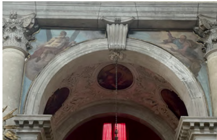
Fig. 26: Pietro Longhi, Santi apostoli Andrea e Pietro . Venezia, chiesa di San Pantalon.

Procedendo verso l'uscita della chiesa ed in base ai loro attributi troviamo questa disposizione del ciclo dei Dodici Apostoli.