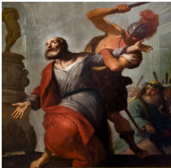
Fig. 14: Pietro Uberti, San Filippo percosso da un soldato , Venezia, chiesa di San Stae.

Sulla parete sinistra in alto troviamo di Silvestro Manaigo (1670-1748) San Matteo , di Giambattista Mariotti (1694-1765) San Giuda Taddeo , di Angelo Trevisani (1669-1753) San Simone ; mentre in basso di Giambattista Tiepolo (1696-1770) Martirio di San Bartolomeo , di Sebastiano Ricci (1659-1734) San Pietro liberato dal carcere e di Antonio Balestra (1666-1740) San Giovanni evangelista martirizzato 199 .