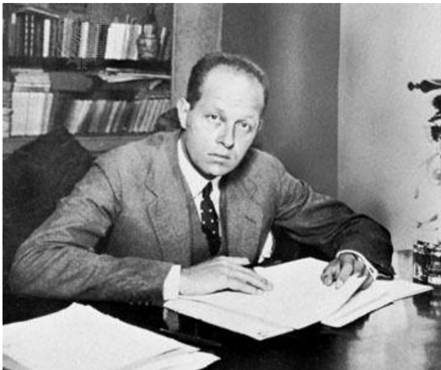
Pierre Drieu La Rochelle

Drieu La Rochelle è un personaggio molto controverso nello scenario intellettuale francese durante l'Occupazione. Apertamente antisemita e forte sostenitore della politica della Collaborazione, fu tuttavia uno dei primi intellettuali collaborazionisti ad accorgersi dell'imminente sconfitta che Hitler avrebbe subito nell'arco di pochi anni, pur non negando la sua ammirazione per la Germania. Credeva fortemente nella possibilità di realizzare una nuova Europa facendo rinascere la Francia con la guida della Germania. Era conosciuto come un eminente uomo di lettere e un noto collaborazionista, grande ammiratore delle idee naziste e promotore di una collaborazione franco-tedesca ancor prima della guerra. Secondo Lacretelle Drieu si caratterizzava per