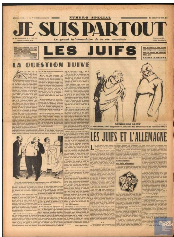
Testata di Je suis partout

Un esempio di primordine della stampa collaborazionista fu il giornale Je suis partout , che era nato nel novembre 1930 come un giornale di estrema destra di estrazione maurassiana per volere di Arthème Fayard. La novità che Je suis partout portò con sé era quella di informare i suoi lettori riguardo al mondo internazionale attraverso molti servizi esteri e traduzioni della stampa straniera. Nei primi mesi del 1934 con la morte in circostanze misteriose del truffatore Stavisky, situazione che diede vita a una crisi politico-economica che simbolizzava anche una crisi di regime, fu proprio Je suis partout che tradusse le pagine del quotidiano nazista Volkischer Beobachter riguardanti il caso Stavisky scrivendo che