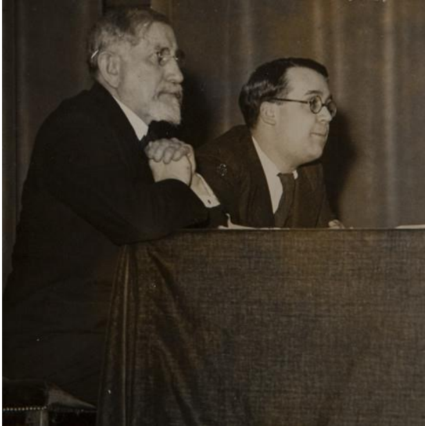
Charles Maurras e Robert Brasillach

Brasillach è uno degli intellettuali più discussi e ambigui del periodo di Vichy in Francia. Questa ambiguità è dettata dal fatto che questo intellettuale, schieratosi dalla parte di un'attiva collaborazione con l'occupante tedesco, sostenne fino all'ultimo che questo suo atteggiamento era dettato solamente dall'amore per la sua patria. Nei suoi articoli ribadiva che il suo appoggio nei confronti della collaborazione era dettato dalla sua speranza che la Germania potesse aiutare la sua amata Francia a combattere la decadenza del presente e a rinascere nei panni di una nazione rinnovata e forte in un nuovo contesto europeo. A Brasillach la Germania appare come una sorella arrivata in aiuto della Francia per farle ritrovare la retta via e non viene considerata come il padrone. Nel pensiero di Brasillach si intrecciano dunque nazionalismo, fascismo e nazionalsocialismo in un modo unico e non riscontrabile in altri intellettuali dell'epoca. Apertamente filotedesco, quando tuttavia si rende conto della sconfitta di Hitler, scrive in Journal d'un homme occupé :