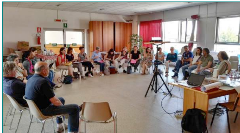
Momento di rielaborazione finale

Altri aspetti affrontati durante la discussione ed il confronto finale sono: la necessità di svolgere anche un lavoro di informazione e sensibilizzazione, al fine di migliorare la conoscenza della cittadinanza rispetto a determinate tematiche ed eliminare il pregiudizio che colpisce chi si rivolge ai Servizi Sociali per un semplice aiuto (in primis nelle scuole), la difficoltà nel chiedere aiuto e l’enorme beneficio che si riceve invece successivamente, l’importanza di lavorare in rete tra professioni e Servizi diversi, in particolare quando si ha a che fare con tematiche complesse.