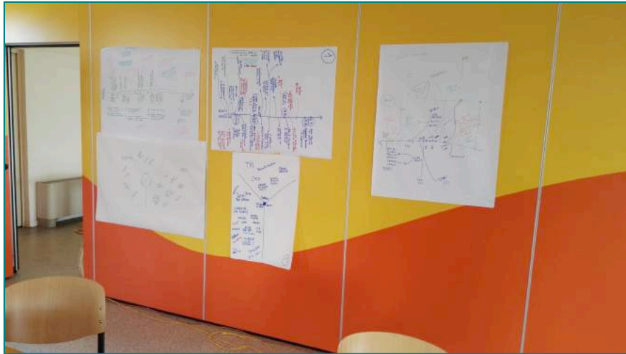
Mappe prodotte dai singoli gruppi di lavoro

La consapevolezza che fa da sfondo a tutta la storia e con cui dobbiamo fare i conti ha a che fare con la scarsa disponibilità di risorse, che accomuna ormai tutti i soggetti, del pubblico, del privato e del privato sociale. Si finisce, dunque, per scegliere spesso il “meno peggio”, con tutte le conseguenze che questo comporta.