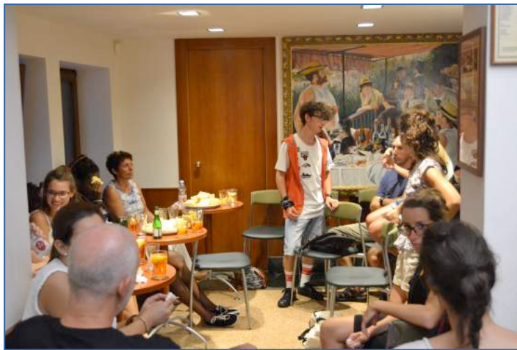
Incontro con i ragazzi presso "Il pane quotidiano", Vicenza

di comprendere e affrontare situazioni, per loro, problematiche. Ecco perché gli adulti facenti parte del mondo dei Servizi si rivolgono a loro esclusivamente per comunicare decisioni già prese, spesso in modo semplificato e lacunoso. Dalle testimonianze raccolte in numerosi programmi che coinvolgono la categoria dei minori accolti, emerge, invece, che i bambini sono in grado di riconoscere le difficoltà dei propri genitori e della situazione familiare che stanno vivendo, come sono in grado di comprendere la necessità di un loro collocamento esterno alla famiglia. I bambini sono, dunque, soggetti in grado di comprendere ed esercitare la propria agency, anche in situazioni di difficoltà; la richiesta che ci fanno è proprio quella di riconoscere loro questa capacità e di trattarli come dei soggetti che non possiedono solo bisogni ma anche diritti, in primis il diritto ad essere ascoltati e coinvolti nelle decisioni che li riguardano in prima persona. Dare protagonismo ai bambini e ragazzi che sperimentano esperienze di allontanamento dalla propria famiglia significa, quindi, trattarli in modo uguale agli altri.