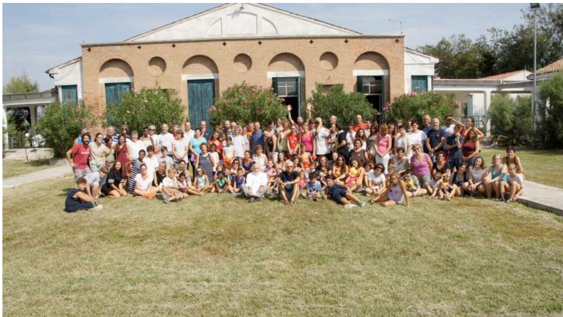
Foto di gruppo partecipanti Laboratorio Cittadini Accoglienti 2016

Della Carta di Cà Roman e del tema della continuità parleremo, in modo un po' più approfondito, nel prossimo capitolo.