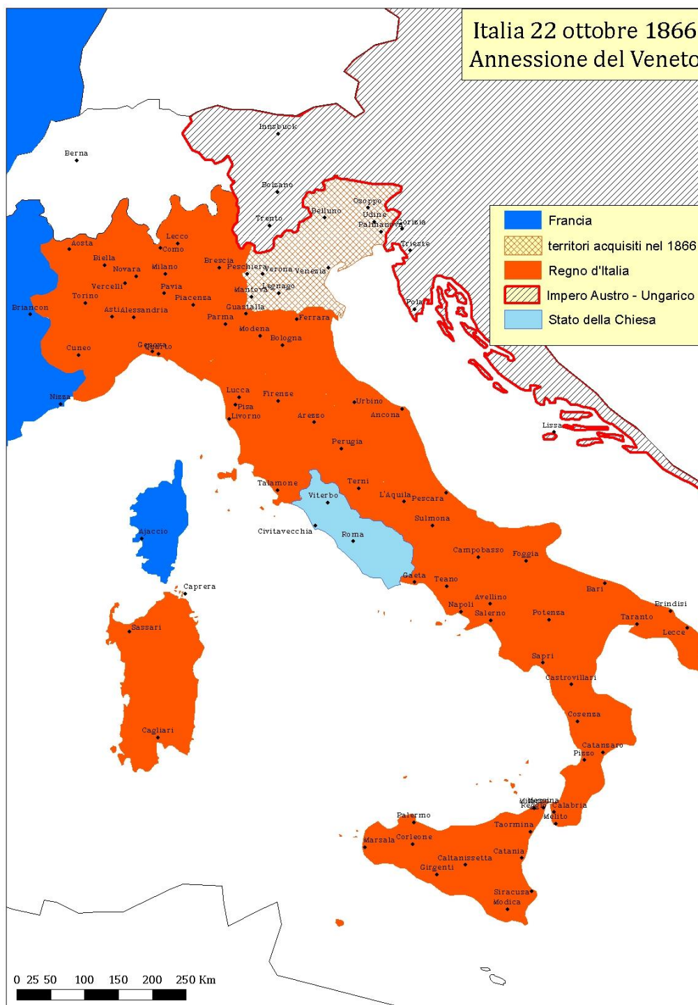
Figura 3.1. Cartina dell'Italia relativa al 22 ottobre 1866, giorno dell'annessione del Veneto al Regno d'Italia. Consultabile online alla pagina web: https://www.150anni.it/webi/index.php?s=30&wid=1079 , data ultima consultazione: 26/01/2024.