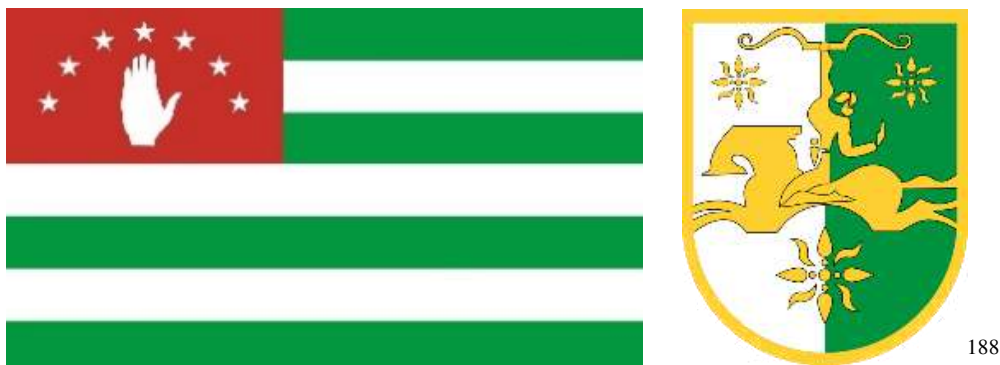
Figura 2 - Bandiera e stemma dell'Abkhazia

In un primo momento, nonostante lo sconvolgimento politico avvenuto a Mosca, la situazione in Abkhazia non risultava essere del tutto negativa. Nella prima Costituzione, approvata nel 1925 in seguito al terzo Congresso dei Soviet di Abkhazia, la piccola Repubblica costiera venne infatti dichiarata sovrana ed indipendente, sebbene strettamente legata alla Georgia. 186 Solo un anno più tardi, dopo la revisione delle rispettive Costituzioni, Georgia e Abkhazia resero legalmente vincolanti i loro rapporti. 187 Al di là delle dispute riguardo lo status legale che le venne riconosciuto, fu in questo stesso periodo che vennero confermati i simboli che, ancora oggi, distinguono la Repubblica di Abkhazia.