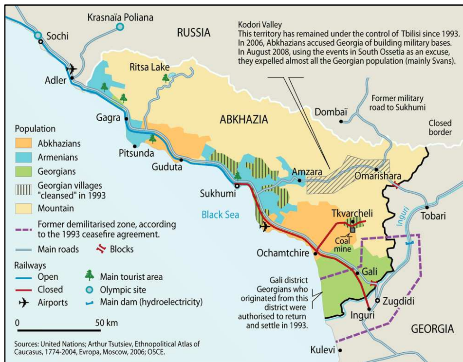
Mappa 2 - L'Abkhazia durante la guerra del 2008