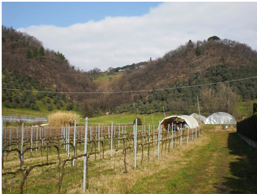
Fig. 5.2 - Uno scorcio con il vigneto, la rimessa degli attrezzi, le serre e, sullo sfondo a destra, la collina con l'uliveto

Oltre alle asine in fattoria sono presenti anche alcune galline, allevate esclusivamente per le uova. Inoltre, vicino alla collina degli ulivi, sono presenti anche varie arnie dove vengono allevate le api per la produzione del miele. La proprietà della fattoria, oltre all'area appena descritta che circonda l'edificio principale, si estende anche ad alcuni campi in una località vicina a Marsan, che vengono coltivati con prodotti orticoli di vario genere.