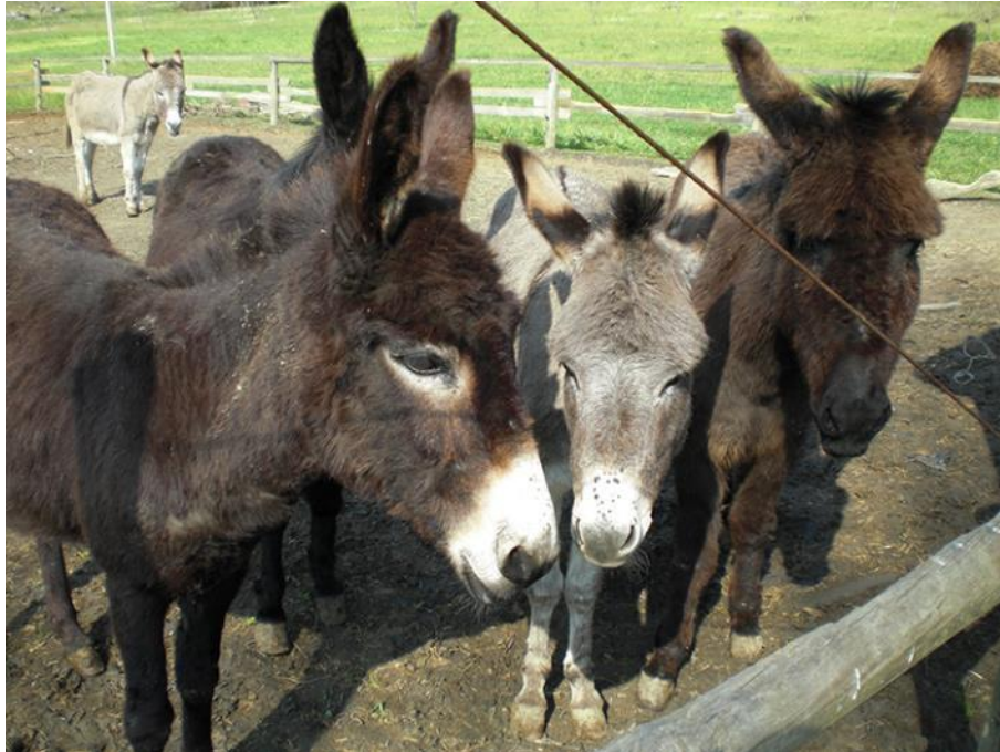
Fig. 5.4 - Le asine della Pachamama