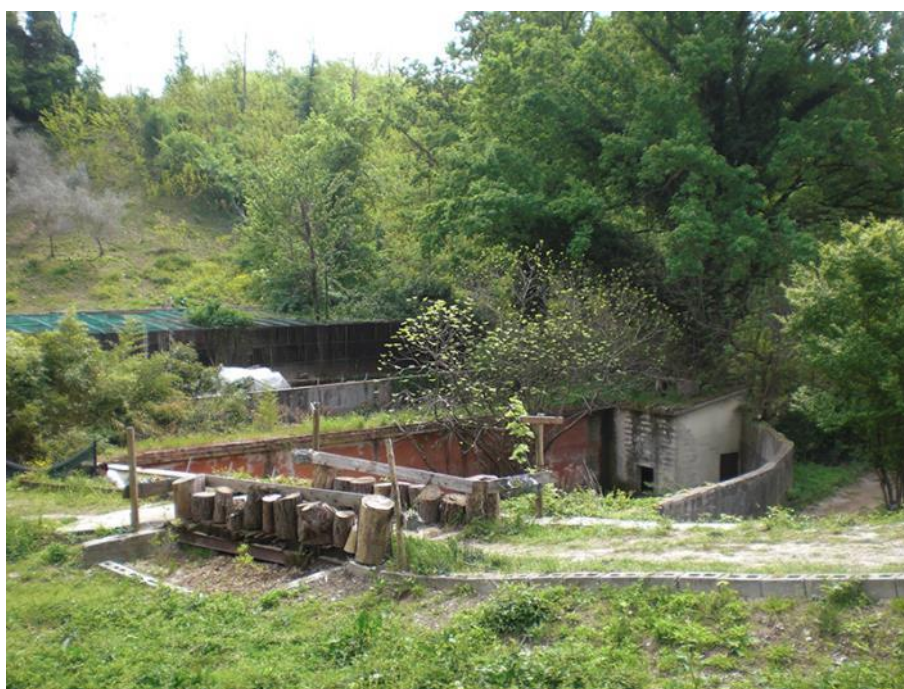
Fig. 3.1 - Uno scorcio del Parco Lonzina

Massimo è un coadiutore professionista dell'asino, ha svolto il corso presso La Città degli Asini di Polverara e ha partecipato a diversi corsi di aggiornamento presso altre sedi. Oltre a ciò, Massimo ha svolto una ricerca personale sul mondo degli asini rivolgendosi ai più importanti asinieri d'Italia e lavorando con loro per alcuni periodi. Fra questi ha lavorato con Massimo Montanari, punto di riferimento per la pratica del trekking someggiato, e Francesco de Giorgio, specializzato nella relazione uomo-animale. Prima di dedicarsi alle attività con gli asini, Massimo ha lavorato per vari anni come attore professionale di teatro e, per questo, aveva avuto spesso la possibilità di entrare in contatto con bambini e disabili, seguendo alcuni progetti e laboratori. Successivamente Massimo ha aperto una sua falegnameria e, all'interno di essa, ha continuato a