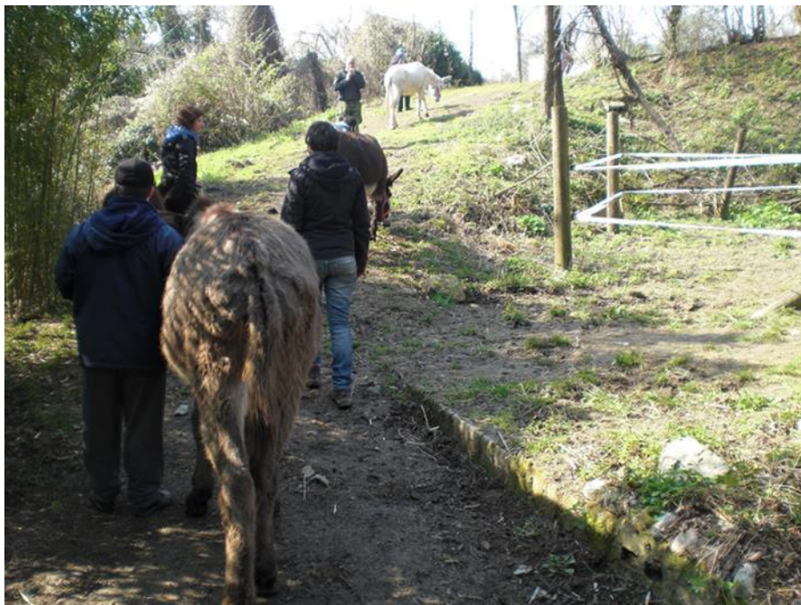
Fig. 3.9 - Il gruppo durante il cammino