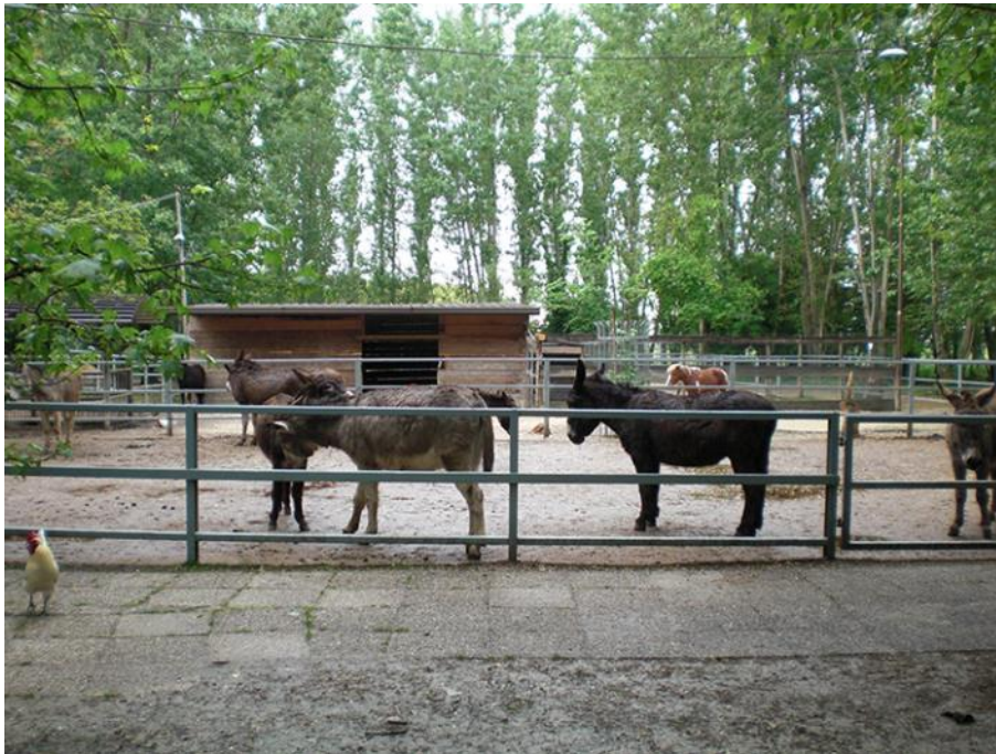
Fig. 4.1 - Il recinto principale