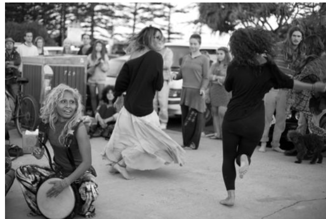
Figure 5 e 6: Alcuni dei ragazzi del “circle” di Byron Bay. Nella foto di destra si intravedono sullo sfondo i passanti che si fermano a guardare le danze e ad ascoltare la jam session improvvisata.

A Darwin, a migliaia di chilometri di distanza, riconosco le stesse dinamiche osservate a Byron Bay; anche in questo caso certi turisti alternativi si sono appropriati, o meglio, hanno riutilizzato il grande parcheggio che guarda la splendida Mindil Beach. Assieme a loro le persone aborigene utilizzano questa zona forse preferendola alle aree più centrali. Non credo