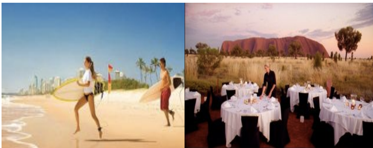
Figure 2 e 3 Due classiche vedute che promuovono l'Australia: da un lato il mare e il surf a portata di tutti, e sullo sfondo i grattacieli della città moderna; dall'altro la rara bellezza dell'outback, riproposta in chiave confortevole ed elegante. (Immagini tratte dalla campagna pubblicitaria There's nothing like Australia di Tourism Australia 2013)

Attualmente, l'Australia è l'ottavo Paese per importanza del mercato turistico, settore che sta diventando sempre più, un bacino strategico per gli investitori stranieri e locali. Il turismo rappresenta quindi una branca interessante di questa vivace economia dando da lavorare a circa novecentomila australiani, sia direttamente, che indirettamente.