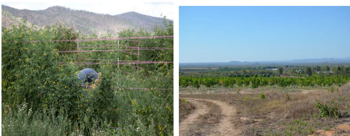
Figure 8 e 9. A sinistra raccolta di pomodori nei campi. A destra vista da una lieve altura dei capi di Dimbulah, sullo sfondo si vedono delle abitazioni e la farm presso cui ero impiegata.