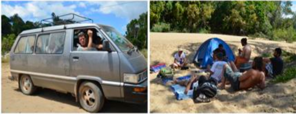
Figure 3 e 4: Un Ragazzo mi chiede indicazioni per arrivare alla spiaggia di Kuranda. Piccolo gruppo di backpacker appena accampati alla suddetta spiaggia.

Talvolta in modo originale backpacker, girovaghi, vagabondi e moderni hippie si uniscono formando un'unica tipologia di viaggiatori, capaci di condividere la medesima idea di spazio.