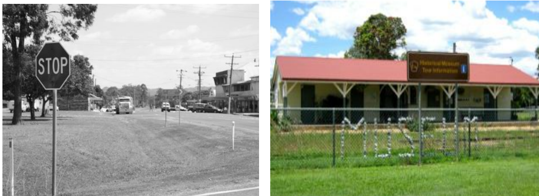
Figure 8 e 9. La prima è una veduta della via principale di Dimbulah. (Foto di D. Montagner) Nella seconda immagine si può vedere il piccolo museo (Immagine tratta dal sito: www.trc.qld.gov.au/facilities/dimbulah-railway-museum-infor ).

particolare è ricordata in una sezione del museo interamente dedicata all'invenzione di un particolare macchinario per la raccolta del tabacco, da parte di un cittadino.