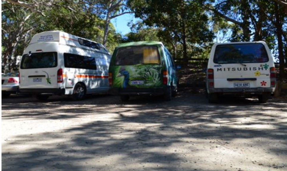
Foto 2. Tre diversi tipi di caravan: i due sulla sinistra sono noleggiati, mentre il terzo è il mio van, acquistato a Sydney e successivamente rivenduto a Cairns.

Ci si riconosce perché si adottano delle performance largamente condivise, che vanno dal modo di vestire sempre un po' "stropicciato", all'utilizzo del proprio mezzo come di una vera e propria abitazione - dove si dorme, si cucina e si stendono i panni ad asciugare - alla preferenza per il campeggio libero. Capita che ci si riconosca anche mentre si è alla guida e si scambi un veloce saluto amichevole col van che sta giungendo nella corsia opposta. Il riconoscimento può portare poi all'avvicinamento tra persone e alla divisione di tutta una serie di nozioni e informazioni relative ai luoghi dove trascorrere la notte o dove sostare. Ho imparato che la ricerca di aree attrezzate, in cui siano presenti oltre che barbecue utili per prepararsi il pasto, anche bagni e docce (possibilmente calde), è uno dei problemi principali con cui quotidianamente i backpacker si scontrano. Inoltre, se ad esempio si considera che nel Paese non è consentito pernottare a bordo del proprio mezzo, pena un'ammenda o verbale o pecuniaria, diventa pratica frequente interrogare altri backpacker per ottenere consigli circa i luoghi ritenuti più tranquilli dove poter appunto trascorrere la notte senza l'ansia della polizia: ci dicono che a Surfers Paradise è un problema dormire in van e che è