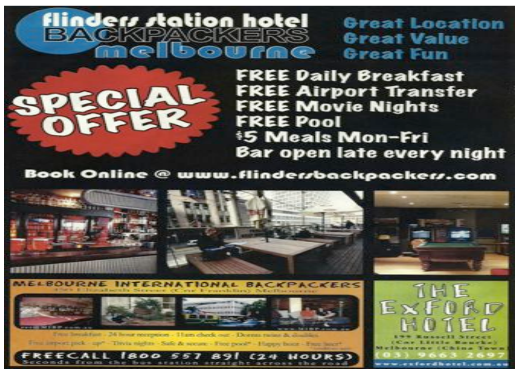
Figura 1. Pubblicità di un ostello di Melbourne tratta dalla rivista “TNT Magazine”, luglio 2012, n° 689. (Scansione personale)

In questo senso l’immagine riportata qui sopra, ci offre l’idea di come questi luoghi siano pensati per offrire tutto il necessario, tanto che uscire e scontrarsi con una località sconosciuta diventa quasi superfluo. Oltretutto, la convenienza cui prima facevo riferimento, non è solo economica, ma è anche di tipo temporale, perdersi, o vagare nella città alla ricerca di passatempi o locali dove trascorrere la serata, non serve perché l’ostello offre tutto lo svago necessario. Al punto che la convenienza, diventa anche di tipo “mentale”, ovvero non è più necessario impegnarsi per risolvere i problemi tipici di chi si sposta autonomamente, come quello del trasferimento fino all’aeroporto, classica difficoltà con cui ogni viaggiatore si deve confrontare. Dalla mattina fino a sera tardi ci si può appoggiare ai servizi offerti dagli ostelli, a mio parere l’idea di un backpacker un po’ indolente e forse non più così abituato ad arrangiarsi è ormai ben nota ai gestori degli ostelli.