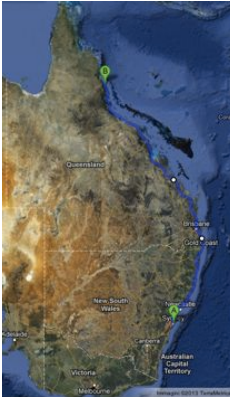
Figura 1. Nella mappa si può vedere il percorso che mi ha portata da Sydney nel New South Wales, fino a Cairns nel Queensland, durante il secondo periodo di ricerche.