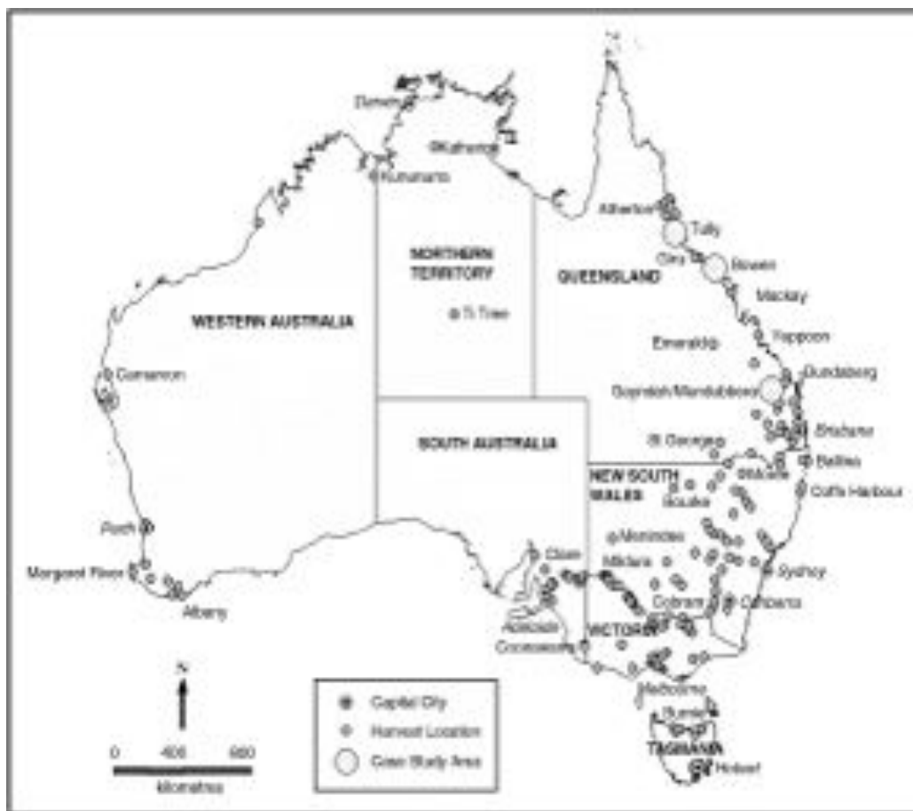
Figura 4. Nella cartina sono indicate col pallino piccolo le zone che richiedono mano d’opera stagionale inserite nel circuito Harvest Trail.