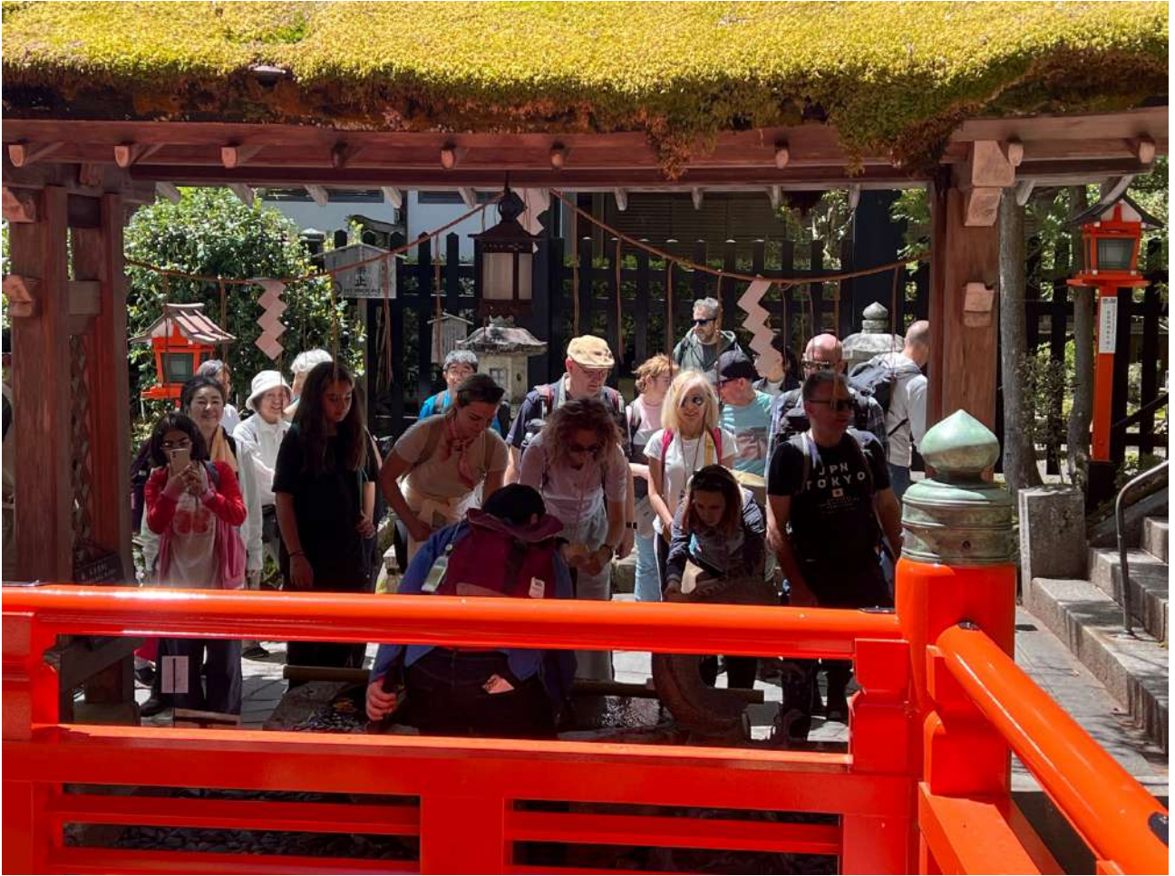
Figura 4 - Rito di purificazione all'ingresso del complesso del Kurama-dera, 24 aprile 2025. Durante la salita al Monte Kurama, il gruppo partecipa al gesto rituale della purificazione con l'acqua, all'interno del recinto sacro. Un momento di passaggio e predisposizione, in cui corpo e intenzione si preparano all'incontro con il luogo.