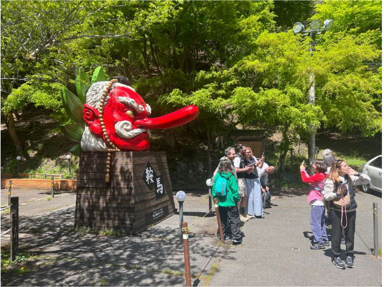
Figura 1 - Il gruppo accanto alla statua del Tengu all'ingresso di Kurama, 24 aprile 2025. Il Tengu, figura leggendaria legata al Monte Kurama, accoglie i visitatori all'inizio del percorso. Il gruppo si prepara alla salita, tra attesa, curiosità e prime fotografie.