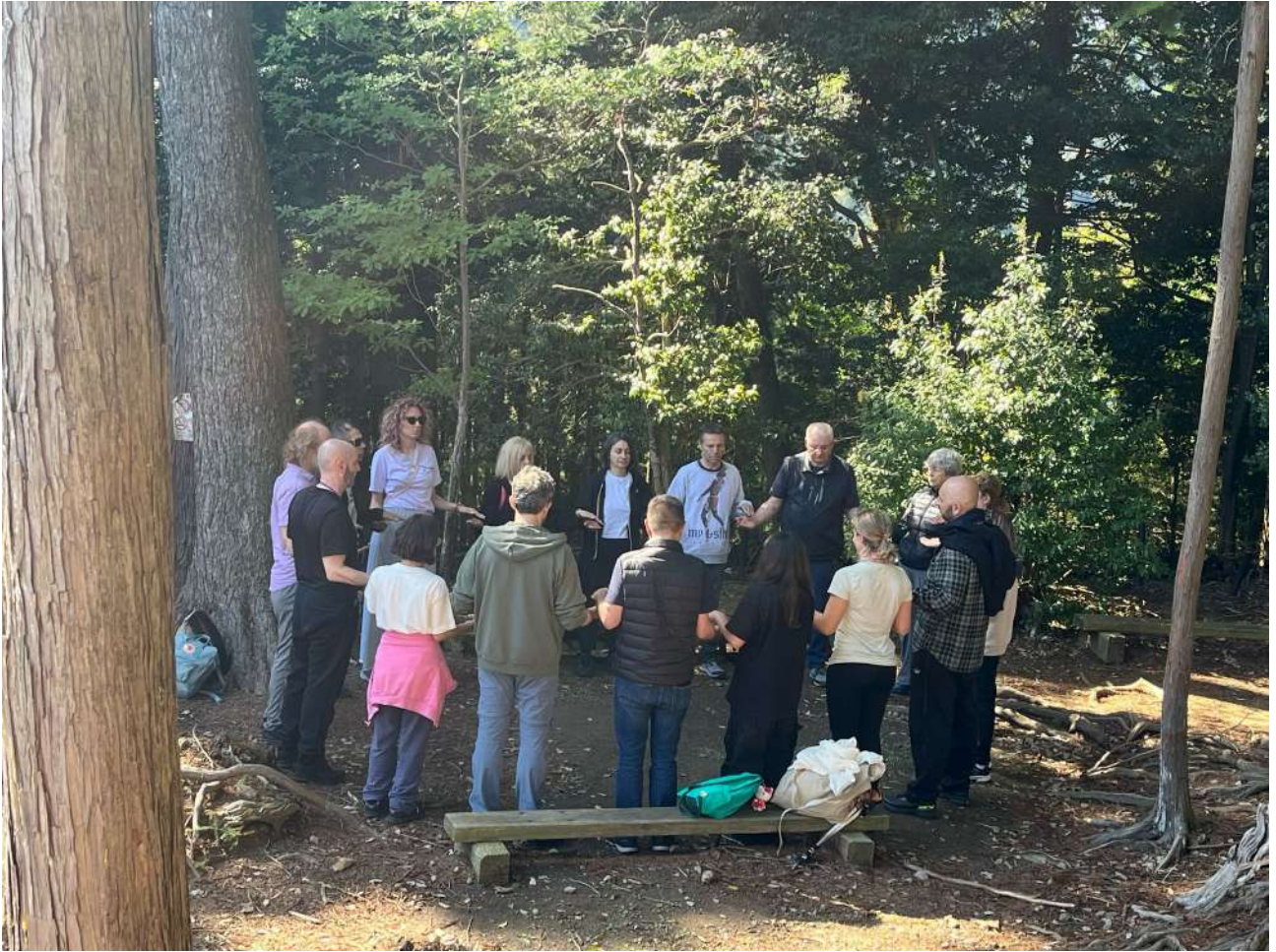
Figura 8 - Cerchio mawashi sull'Okunoin, Monte Kurama, 24 aprile 2025. Nel cuore della foresta sacra, i partecipanti si uniscono in cerchio per il mawashi, pratica collettiva di trasmissione energetica. Il gesto delle mani unite e la recitazione dei gokai in giapponese rendono il momento carico di intensità simbolica e connessione reciproca.