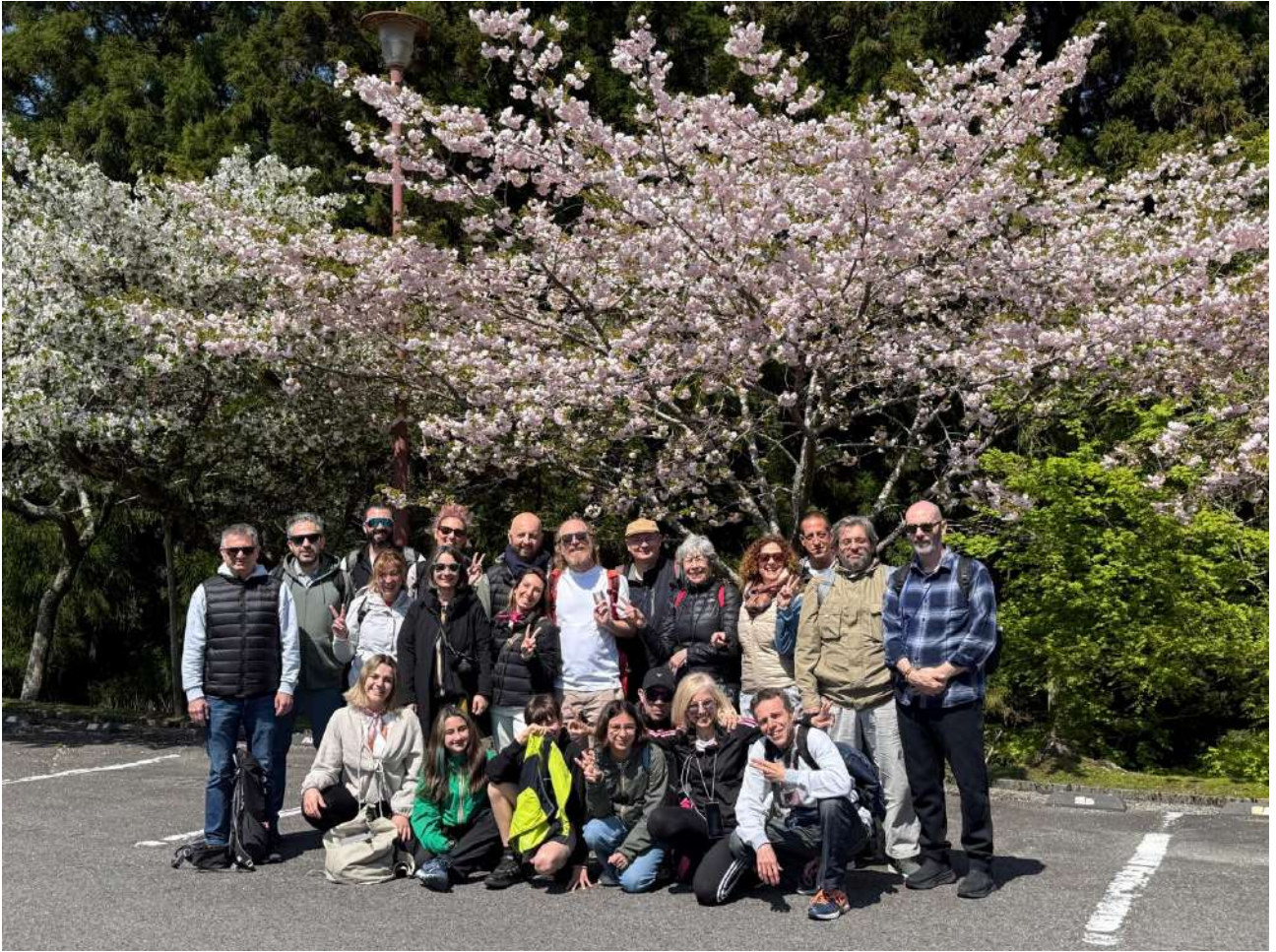
Figura 9 - Foto di gruppo sotto i sakura sul Monte Hiei, 26 aprile 2025.