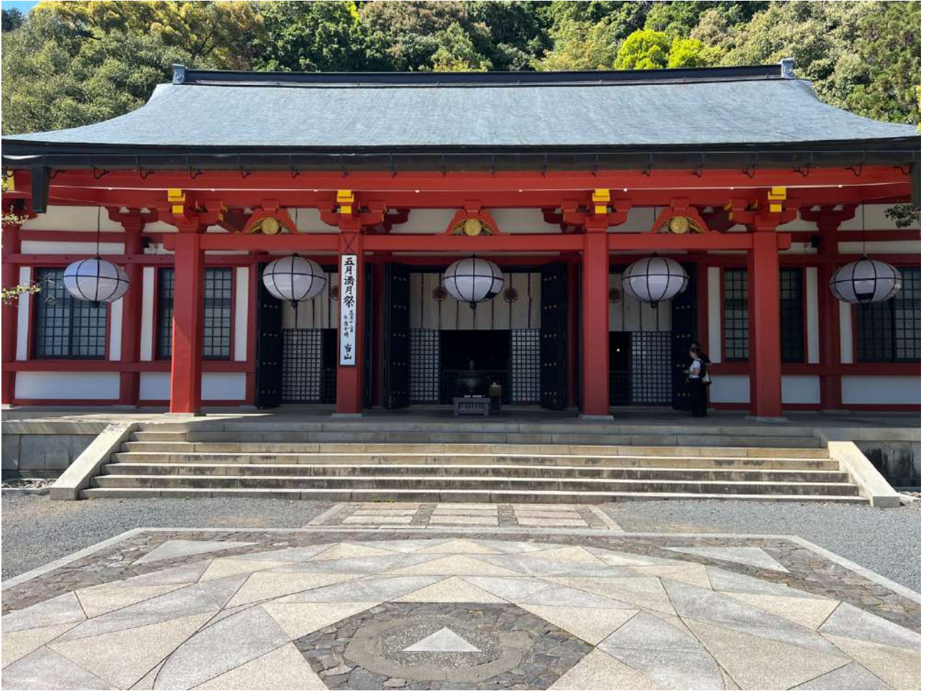
Figura 6 - Il power spot antistante al tempio principale del Kurama-dera, 24 aprile 2025. Situato al centro dello spazio cerimoniale davanti al hondō, il cerchio di pietre rappresenta un punto di forte valenza simbolica e spirituale, luogo di raccoglimento e connessione energetica per molti visitatori.